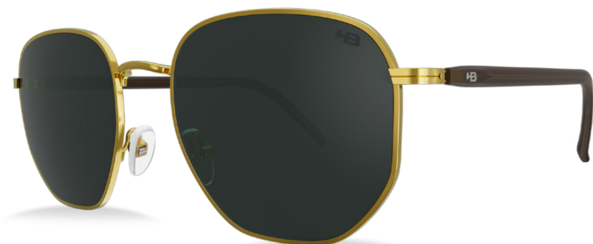
Gold G15 Ref. 10104240164006