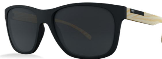
Matte Black / Wood L Polarized Gray