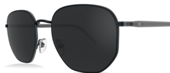
Matte Graphite Gray Ref. 10104240302001

Visão nítida e precisa, com proteção total contra raios ultravioleta e atenuação da luz azul danosa.