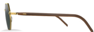
Gold G15 Ref. 10104610164006