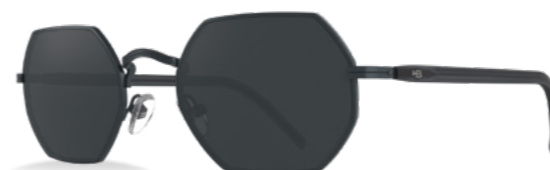
Oc Hb Hbs Slide Ref. 10104610302001

Polycarbonato com tecnologia Photon: Visão nítida e precisa, com proteção total contra raios ultravioleta e atenuação da luz azul danosa.