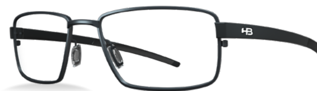
M Black/M Black Ref. 10100590483010