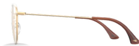
M Deep Blue Ref. 10105340843010