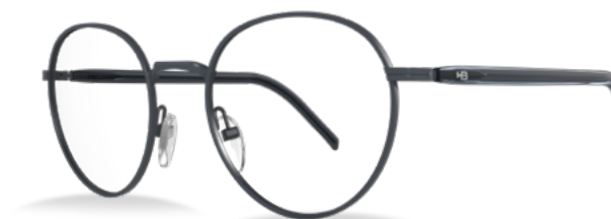
Matte Black Ref. 10103490243010