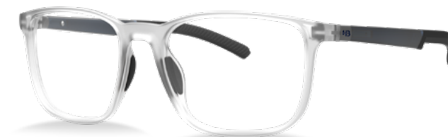
[M Graph/ P Carbon F Ref. 10105290841010