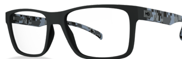
Matte Black D. Graphite Ref. 10101080246010