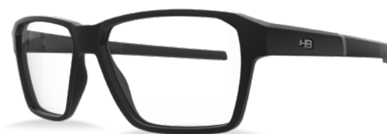
Matte Graphite Ref. 10104590302010