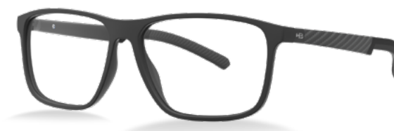
M Print Carbon Fi Ref. 10105200859010