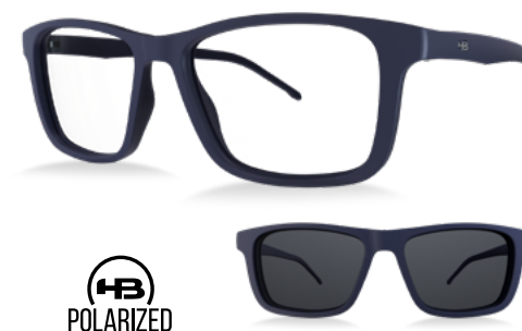
Matte Black / Polarized Gray Ref. 10103510243032