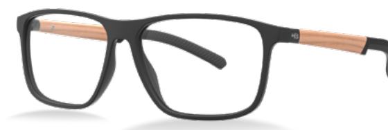
M Bla/Dark Wood Ref. 10105200698010