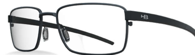
Matte Graphite Navy Ref. 10100580304010