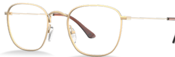
Graphite Ref. 10105340473010