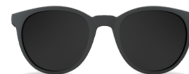
M Grap P Red Ref. 20100080011