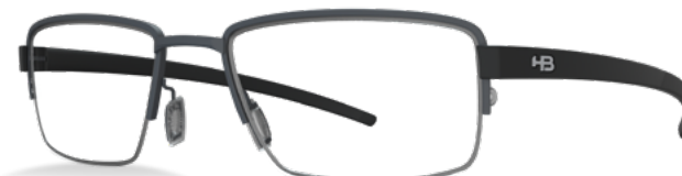
Matte Graphite Yellow Ref. 10100570277010