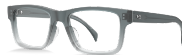
Gradi M Green G Ref. 10105280816010