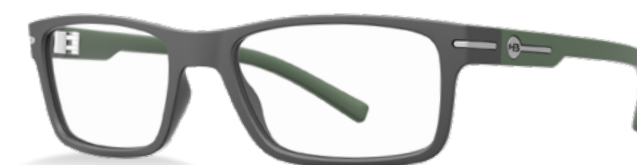
M Crystal/Navy Ref. 10100920829010