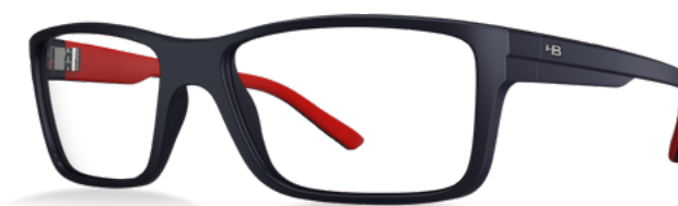
Matte Fade Invert Onyx / Olive Ref. 10101230485010