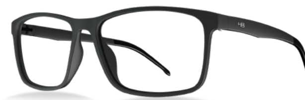
New Graphite Demo Ref. 10102790377010