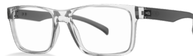
M Black/P White Ref. 10101080821010