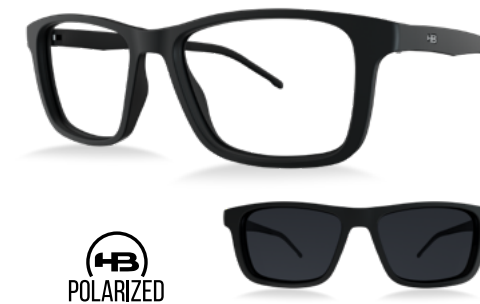
N Carbon Fiber / Polarized Gray Ref. 10103510578032