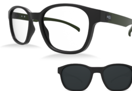
Matte Black / Polarized Gray Ref. 10104480243032