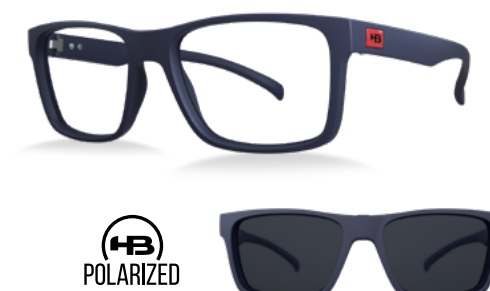
M Black/Wood Polarized Gray Ref. 10103390261032