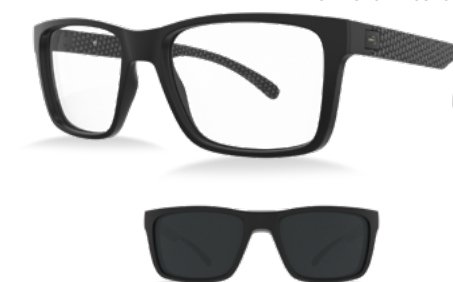
Matte Black Gray/Gamer Ref. 10104720243092