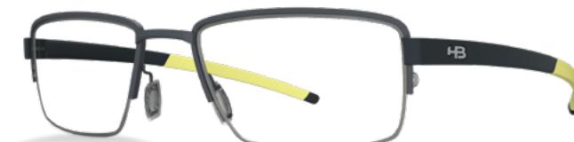
Matte Black Red Ref. 10100570483010