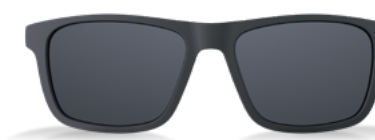
M Navy Silver Ref. 20100240676