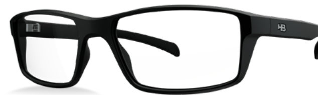
Matte Black D. Red Ref. 10100770251010