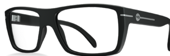
Matte Navy Ref. 10101240312010