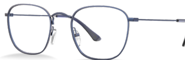
M Deep Green Ref. 10105340844010