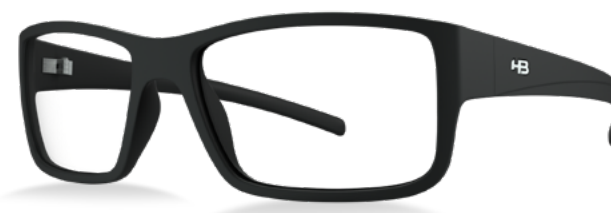
Matte Navy On Marsala Ref. 10101260314010