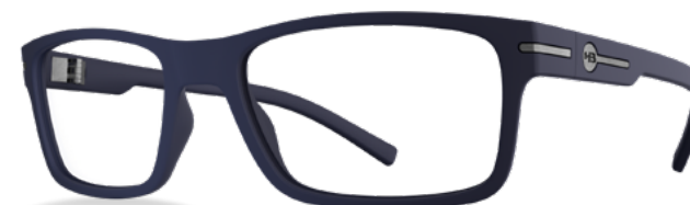
Matte Black Ref. 10100920243010