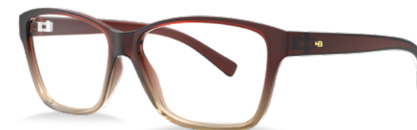
Rose Zebra Ref. 10105160795010