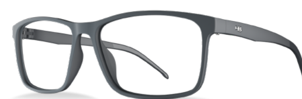
Matte Navy Ref. 10102790312010