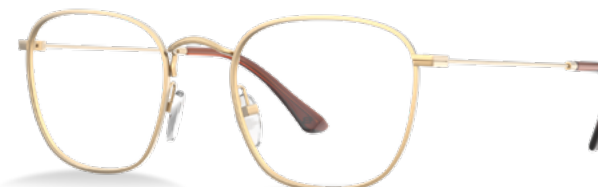
Graphite Ref. 10105350473010