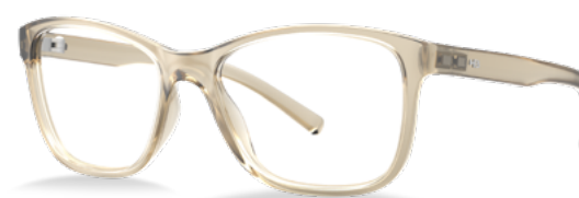
F Passi / L Pink Ref. 10105210117010