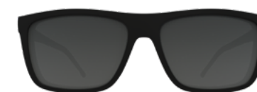
Print Carbon Fi / Polarized Gray Ref. 10103800578032