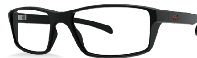
Matte Navy Ref. 10100770312010