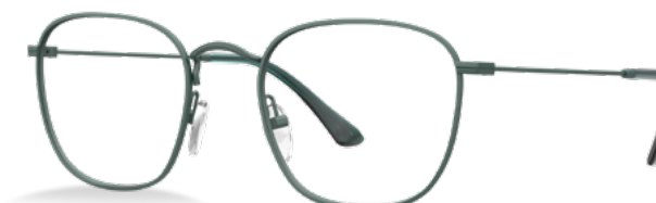
Matte Black Ref. 10105350243010