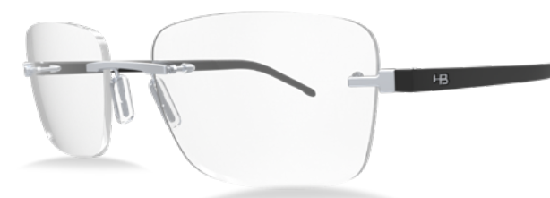
M Grey/Naval B Ref. 10104020633010