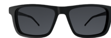
Print Dots Blue / Polarized Gray Ref. 10103800588032