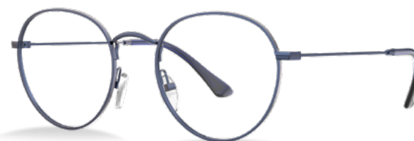
M Deep Green Ref. 10105350844010