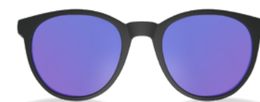
M Black N Drive Ref. 20100080672