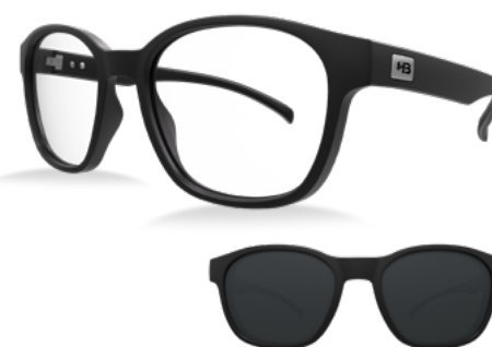
Matte Black Gray Night Drive Ref. 10104480243073