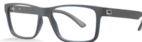
Print Carbon Fi Ref. 10105370578010