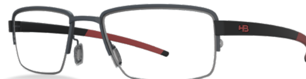
Matte Graphite/ M Night Blue Ref. 10100570810010