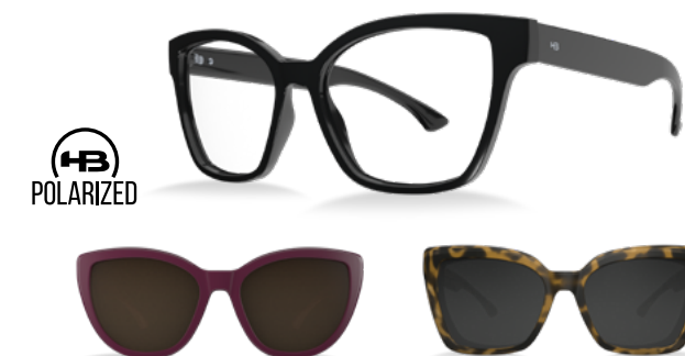
Passionate Polarized Brown Ref. 10104030622034