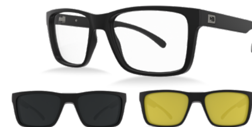
Matte Black Polarized Gray Ref. 10104720243032