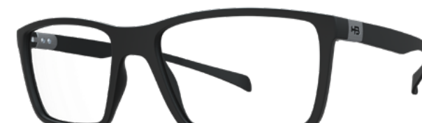
Matte Navy D. Nickel Ref. 10100880517010