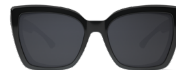
Passio/Po Gray Ref. 20100290061