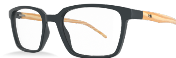
M Ultramar/Onyx Ref. 10104910749010