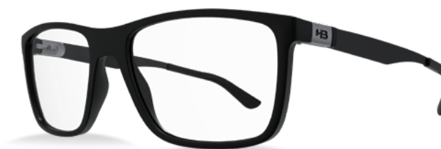
Matte Black Carbon Fiber D Red Ref. 10100870265010