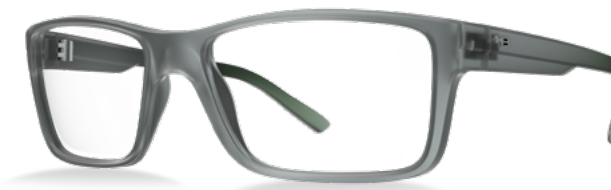
M Black/ L Green Ref. 10101230724010