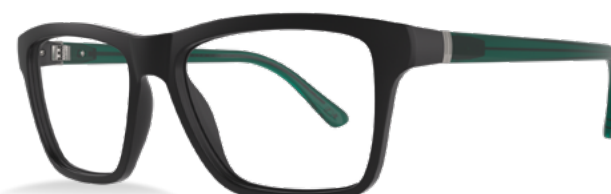
M Shadow Gray Ref. 10104570701010