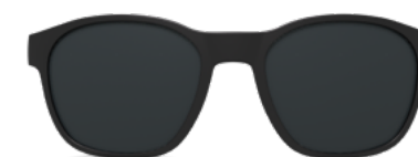
M Navy P Gray Ref. 20100470012