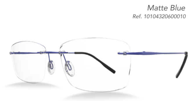
Matte Blue Ref. 10104320600010