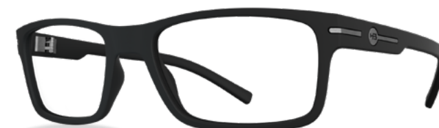
Matte Black D. Blue Ref. 10100920003010