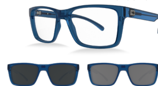
Print Carbon Fi Polarized Gray Ref. 10104720578032