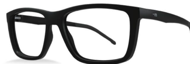
Matte Black / Polarized Gray Ref. 10103800243032

Visão nítida e precisa, com proteção total contra raios ultravioleta e atenuação da luz azul danosa.