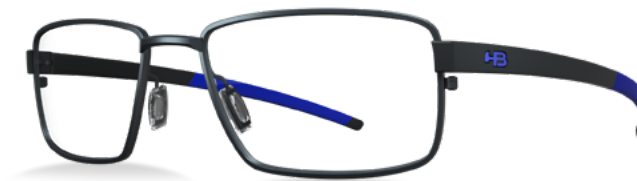
M Grap/N Grap Ref. 10100590305010