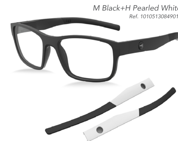
M Black+H Pearled White Ref. 10105130849010