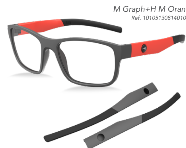
M Graph+H M Oran Ref. 10105130814010