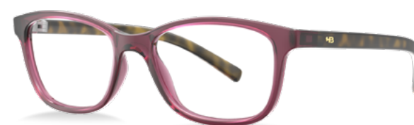
F Brown/N Cream Ref. 10105220495010