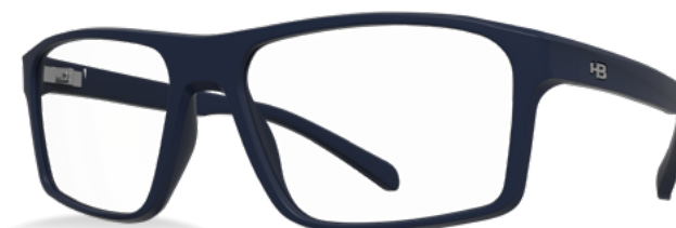
Matte Black Ref. 10100010243010