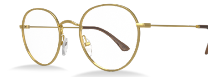
Graphite Ref. 10104510473010