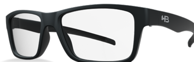
Matte Black D Blue Ref. 10100820003010