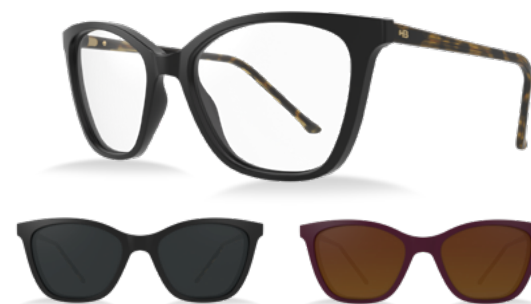
Gloss Black / Black+Havana Polarized Gray Ref. 10103850688032