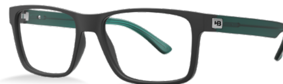
M Black/Wood Ref. 10105370261010