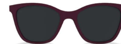
Hav/Pol Brow Ref. 20100330674