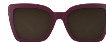
C Hav/Pol Brow Ref. 20100290674