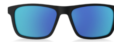
Matte Black P Gray Ref. 20100240009