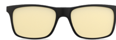
M Black Po Gray Ref. 20100560009