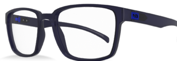
Matte Black Ref. 10104900243010