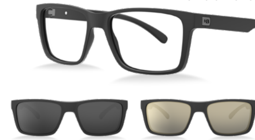
M Clear Coffee / Graynight Drive Ref. 10104720803073