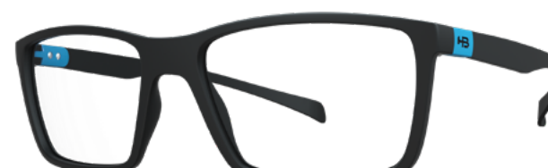
Matte Black Ref. 10100880243010