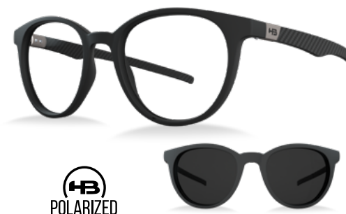
Matte Black D Blue Pol Blue Ref. 10102530003033