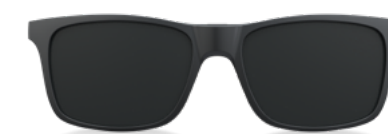
M Navy P Gray Ref. 20100560012