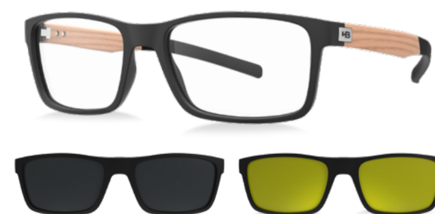
Matte Black / Polarized Gray Ref. 10104260243032