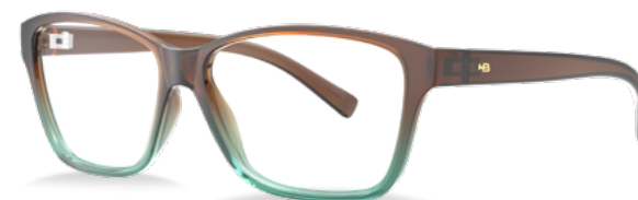
Fade Neo Brown Ref. 10105160115010