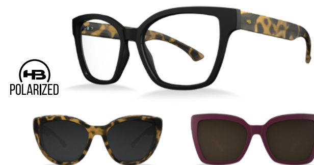
Gloss Black Polarized Gray Ref. 10104030621032