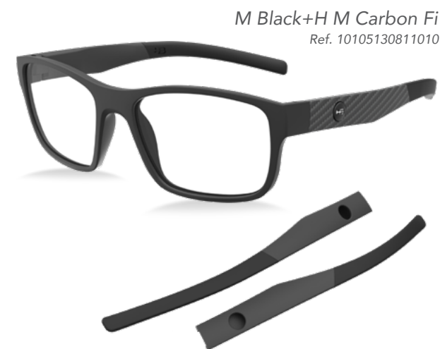
M Black+H M Carbon Fi Ref. 10105130811010