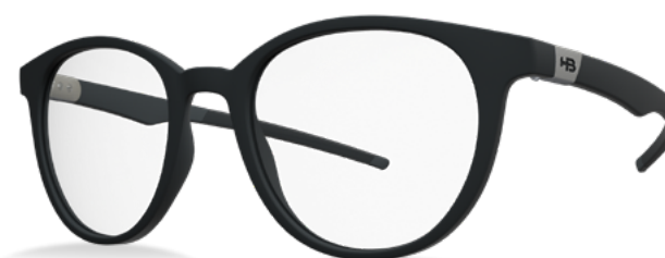
Matte BlackCarbon Fiber Ref. 10100700263010