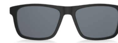
Matte Black/Wood Ref. 20100240014