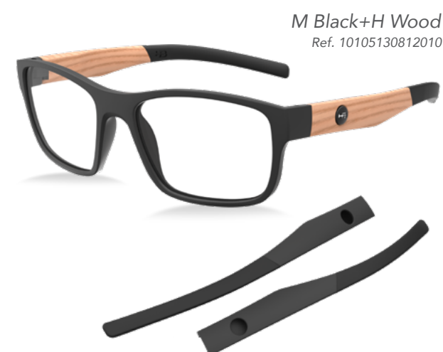
M Black+H Wood Ref. 10105130812010