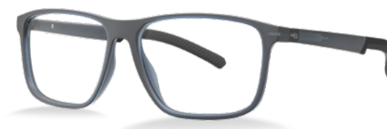
M Marine On Night Ref. 10105200785010