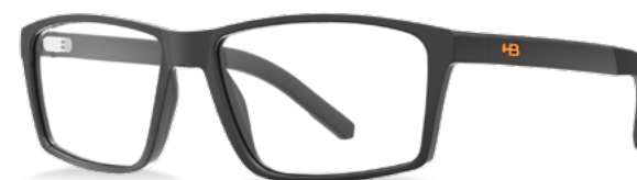
Matte Onyx Ref. 10105100335010