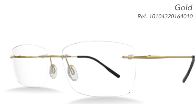
Gold Ref. 10104320164010