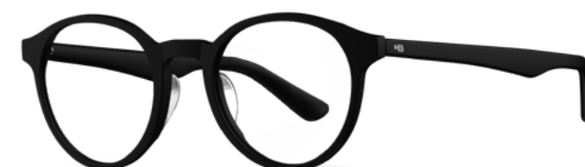
M Ultramarine Demo Ref. 10103970356010