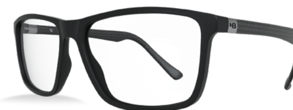
Matte Black Ref. 10103670243010