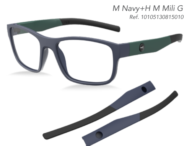
M Navy+H M Mili G Ref. 10105130815010