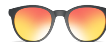
M Black P Blue Ref. 20100080013