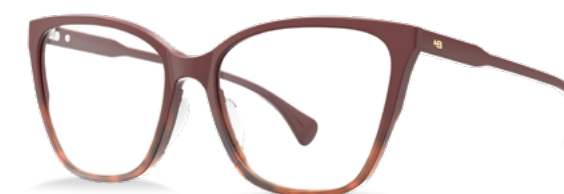
Havana Turtle Violet Shine Ref. 10105040779010