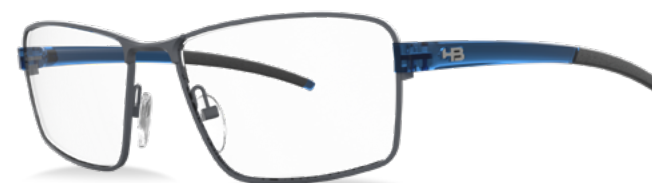
M Black/Onyx Ref. 10104270634010