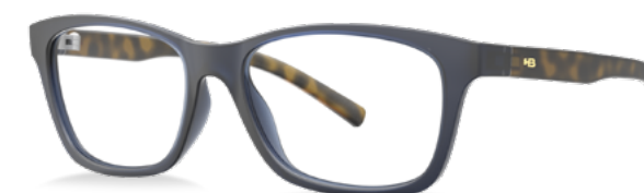
Gloss Black Ref. 10105230149010