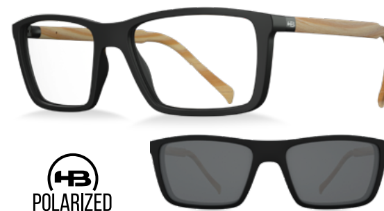
Matte Black / Polarized Gray Ref. 10103790243032