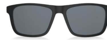
Matte Black P Silver Ref. 20100240015