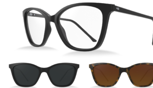
Passionate / Pas + Black Polarized Brown Ref. 10103850689034