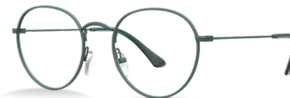
Matte Black Ref. 10105350243010