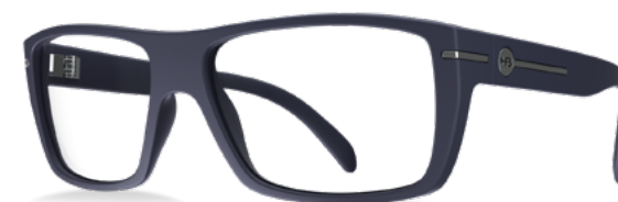
Black/M Blue Ref. 10101240031010