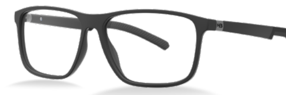
Matte Black Ref. 10105200243010