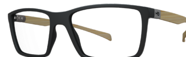
M Graphite/Moss Green Ref. 10100880805010