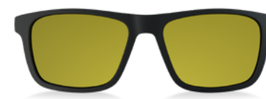
Matte Black P Blue Ref. 20100240013