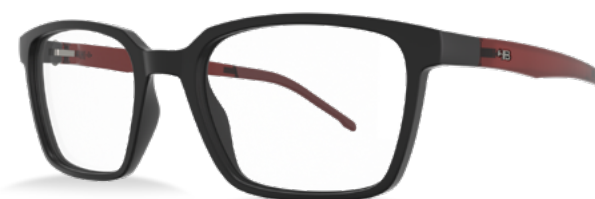
M Graph/ Wood Ref. 10104910737010