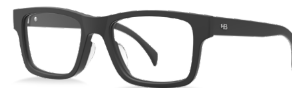
Matte Black Ref. 10105280243010