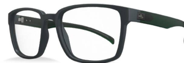
M Night Blue Ref. 10104900699010