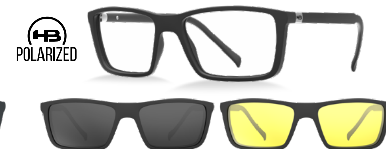
Matte Navy / Graymulti Blue Ref. 10103790312106