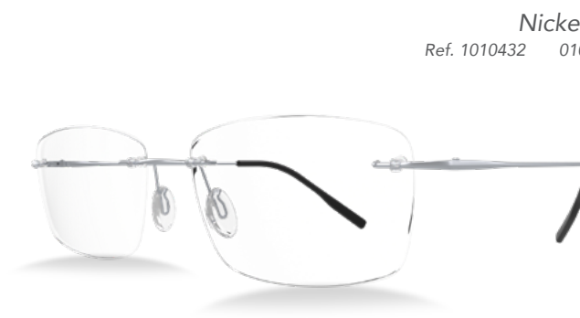
Nickel Ref. 1010432 010