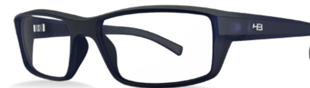
Matte Black Ref. 10101210243010