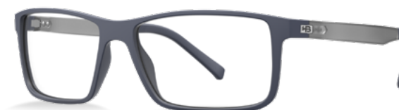
Matte Cafe/ M Ligth Green Ref. 10105090784010