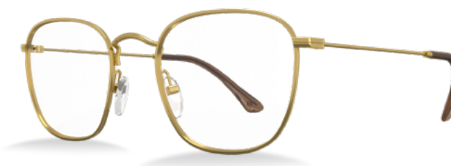
Graphite Ref. 10104500473010