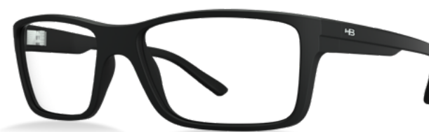
Blue/Red Demo Ref. 10101230475010