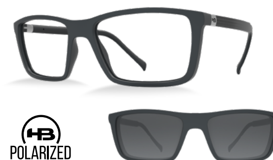
Matte Black / Graynight Drive Ref. 10103790243073