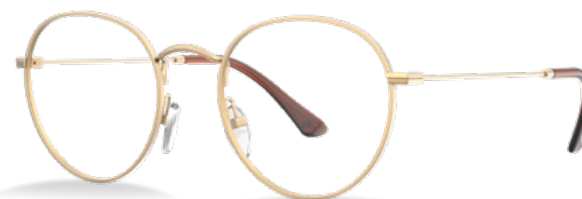
Graphite Ref. 10105350473010