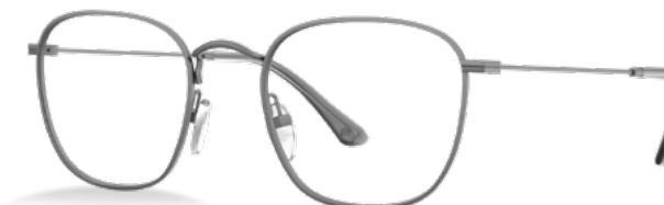
M Deep Blue Ref. 10105350843010