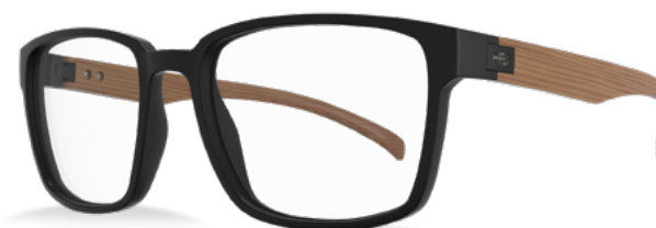
M Gra/Land Green Ref. 10104900748010