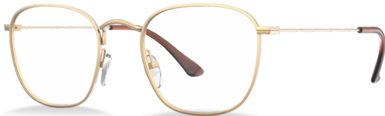
Gold Ref. 10105340164010