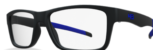
Matte Navy Ref. 10100820312010