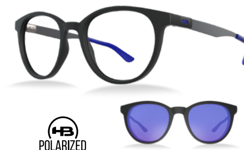
Matte Black Pol Gray Ref. 10102530243032