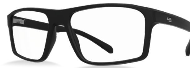
M Fade | Blue M Ref. 10100010553010