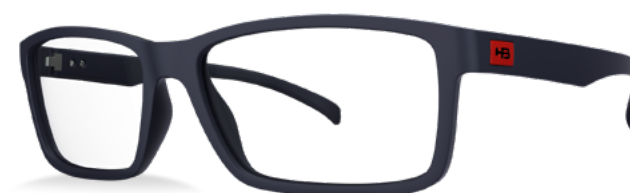
Matte Black Ref. 10100780243010