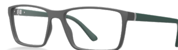
M Navy/P Carbon F Ref. 10105270817010