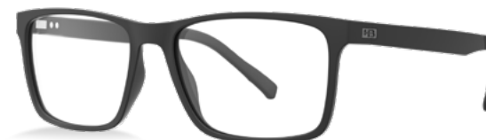
M Steel Blue Ref. 10105080438010