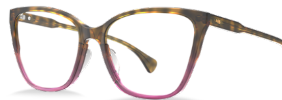
Nude Fade Rose Ref. 10105040780010