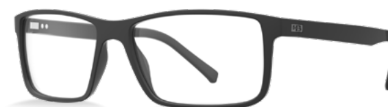
Matte Navy/ M Smoke Ref. 10105090782010