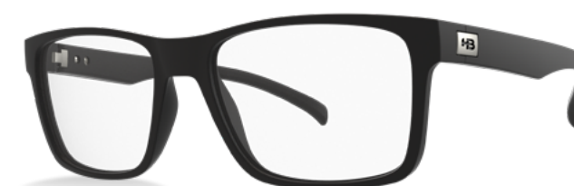
Matte Black / D. White Ref. 10101080252010