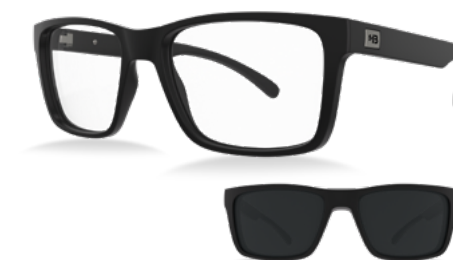
M Naval Blue Gray/Silver Ref. 10104720722091