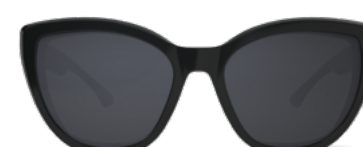
Passio/Po Gray Ref. 20100300061