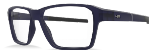
Matte Black Ref. 10104590243010