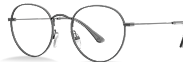
M Deep Blue Ref. 10105350843010