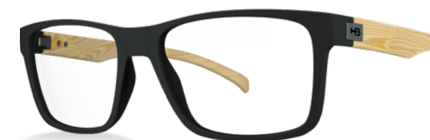
M Greenish Gray/Black Ref. 10101080804010