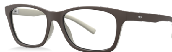
G Blue/ Havana Turtle Ref. 10105230809010