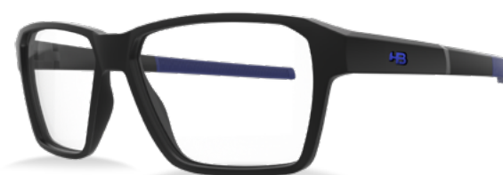
M Night Blue Ref. 10104590699010