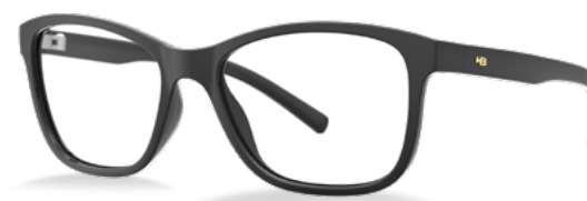
Havana Turtle Ref. 10105210214010