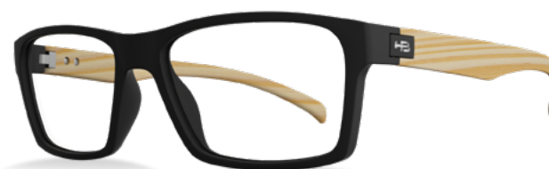
M Crystal/Dark Onyx Ref. 10100930830010