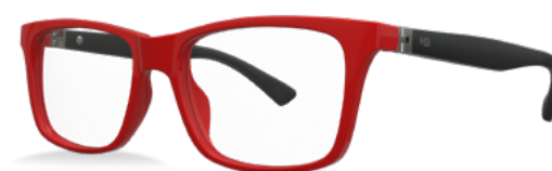
M Fire/M Black Polarized Red Ref. 10104810295044