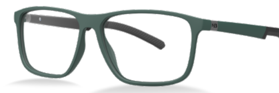
M Military Gree Ref. 10105200807010