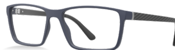
Matte Black Ref. 10105270243010