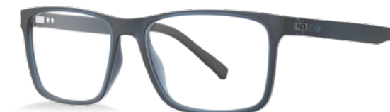
Black/M Blue Ref. 10105080031010