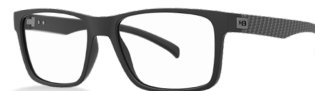
G Crystal/M Onyx Ref. 10101080831010