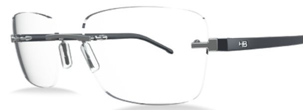
M Grey/M Black Ref. 10104020308010