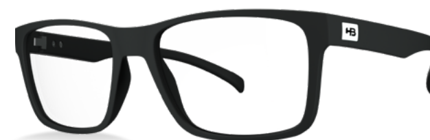
Matte Black Wood Ref. 10101080261010