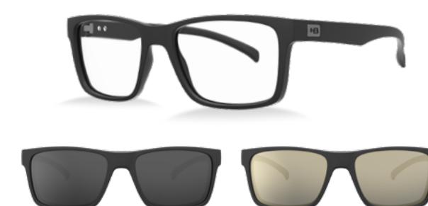
M Military Gree P Solid Green G15/Gray Ref. 10103390807104