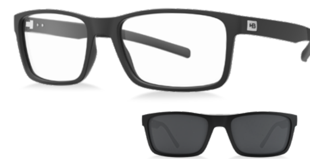
M Black / Gray Night Ref. 10104260243073