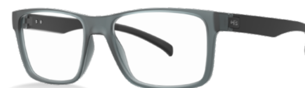
Print Carbon Fi Ref. 1010 1080578010