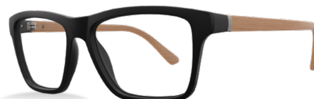
Matte Black Ref. 10104570243010