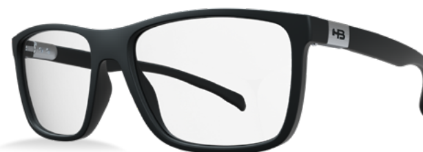
Matte Black D Blue Ref. 10100790003010