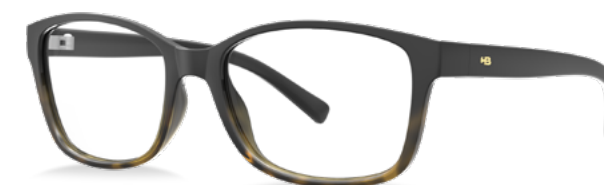
Gloss Black Ref. 10105240149010