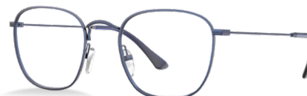
M Deep Green Ref. 10105350844010