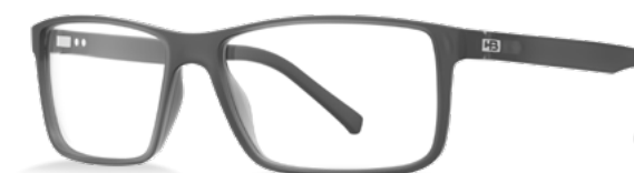
Matte Onyx Ref. 10105090335010