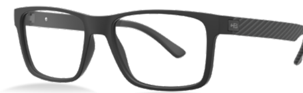
Matte Black Ref. 10105370243010