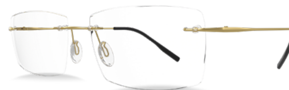
Nickel Ref. 10104780513010