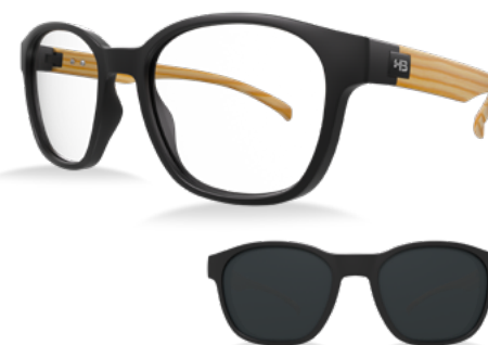
M Black/S Green Polarized Gray Ref. 10104480715032