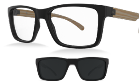
Matte Black Gray/Multi Blue Ref. 10104720243074