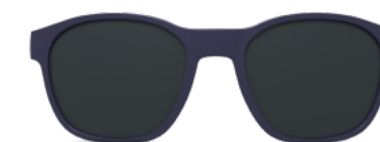
M Black N Drive Ref. 20100470672