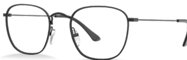
Matte Black Ref. 10105340243010