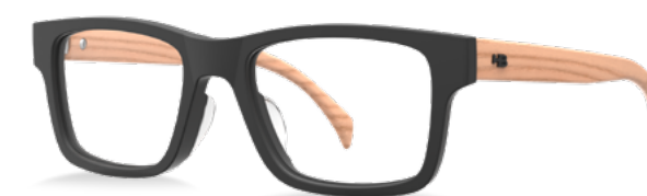
M Black/Wood Ref. 10105280261010