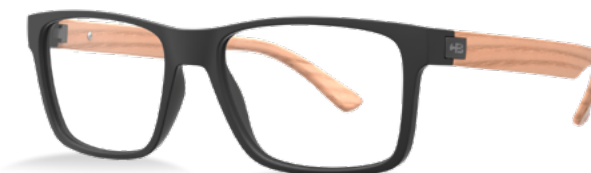
M Steel Blue/Graphite Ref. 10105370839010