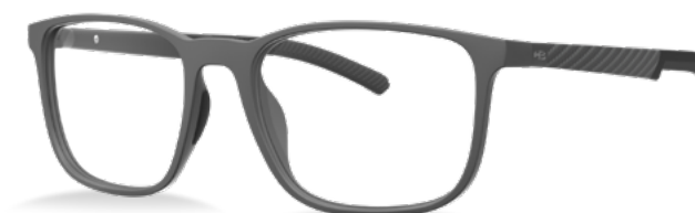
Matte Black Ref. 10105290243010