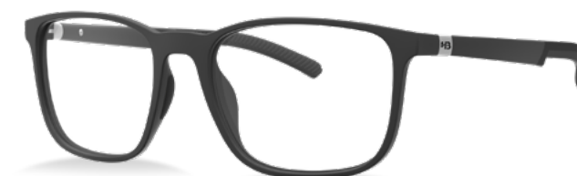
Matte Clear Coffee Ref. 10105290803010