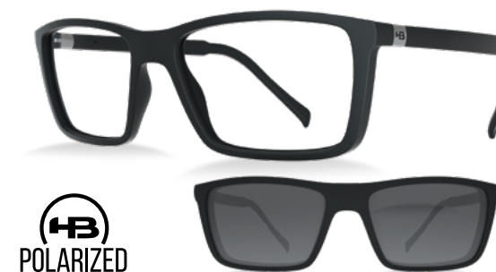
Print Dots Grap / Polarized Gray Ref. 10103790589032