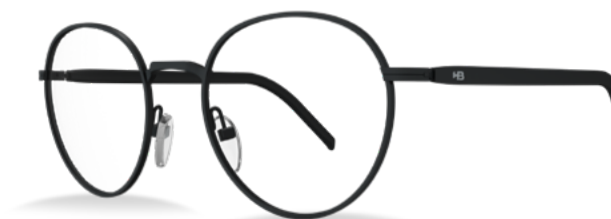
Matte Graphite Ref. 10103490302010