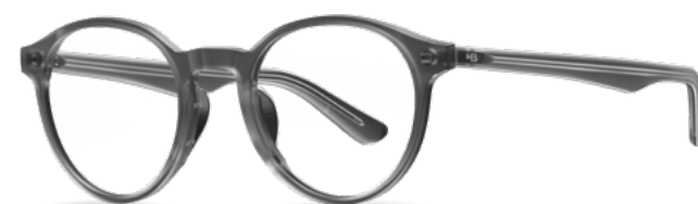
Matte Black Demo Ref. 10103970243010