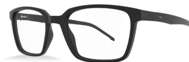
Matte Military Green Ref. 10104910807010