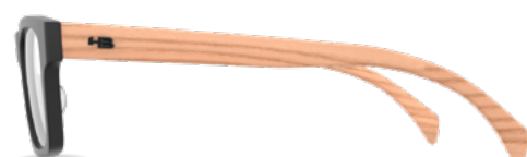
M Graph/P Carbon F Ref. 10105280614010