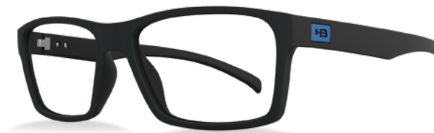
Matte Black Wood Ref. 10100930261010