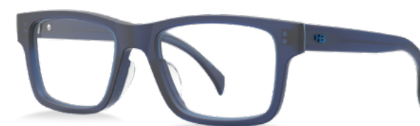
M Night Blue Ref. 10105280699010