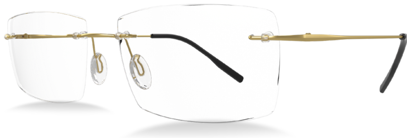
Gold Ref. 10104780164010