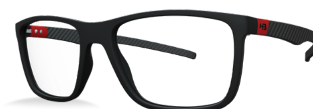
Matte Black Carbon Fiber Ref. 10100870263010