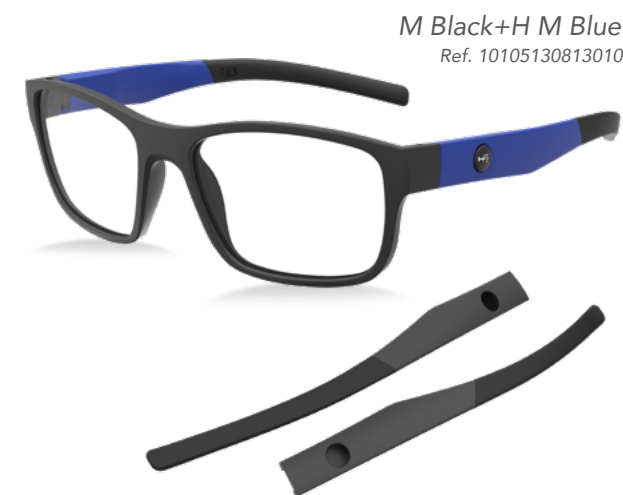
M Black+H M Blue Ref. 10105130813010