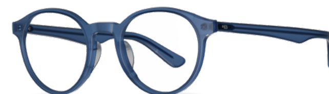
Honey Ref. 10103970640010