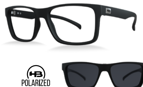
Matte Navy Polarized Gray Ref. 10103390312032