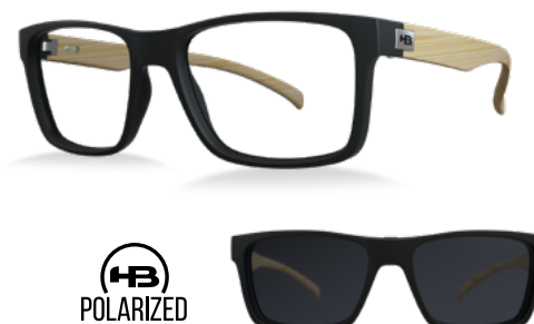
Matte Black Gray/Gamer Ref. 10103390243092