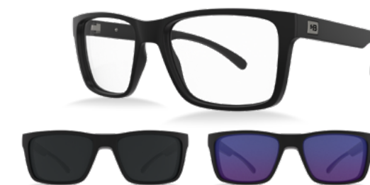
Matte Black Gray/Night Driv Ref. 10104720243073