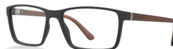
M Grap/Mili G Ref. 10105270818010