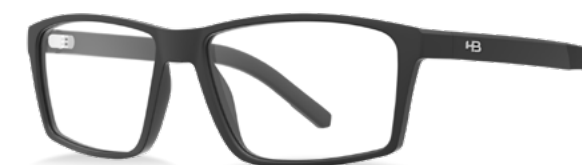
Matte Black Ref. 10105100243010