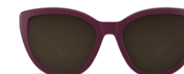
C Hav/Pol Brow Ref. 20100300674