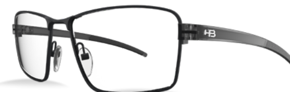
M Graph/M Black Ref. 10104270505010