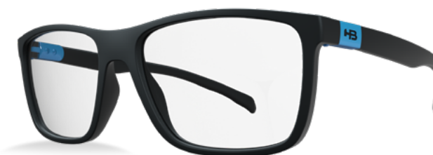
Matte Navy Ref. 10100790312010