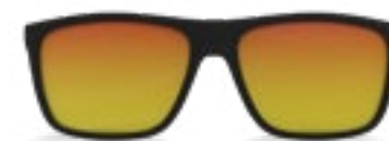
M Black Silver Ref. 20100260671