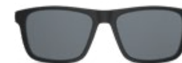
Matte Black Red Ref. 20100240675