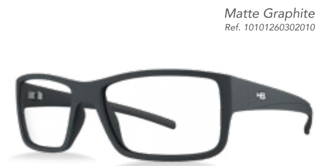
Matte Graphite Ref. 10101260302010