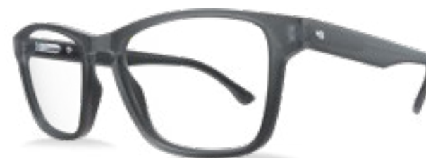
Naval Blue Ref. 10104100629010