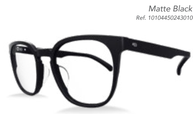
Matte Black Ref. 10104450243010