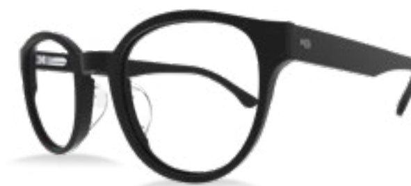
M Black Ref. 10104660243010