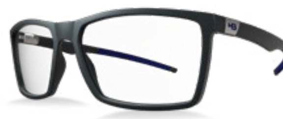
Matte Navy Ref. 10100760312010