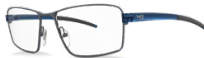
M Black/Onyx Ref. 10104270634010