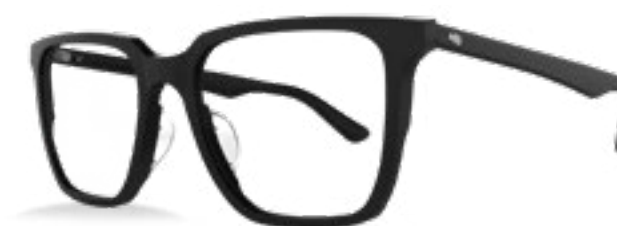
Matte Black Ref. 10103780243010