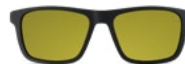
Matte Black P Blue Ref. 20100240013