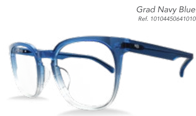
Grad Navy Blue Ref. 10104450641010