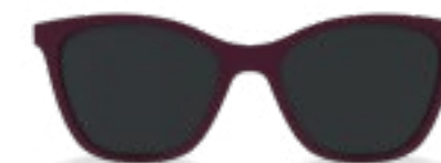
Hav/Pol Brow Ref. 20100330674