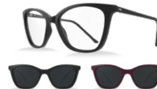
Passionate / Pas + Black Polarized Brown Ref. 10103850689034