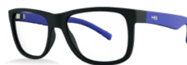
Matte Black Ref. 10100790243010