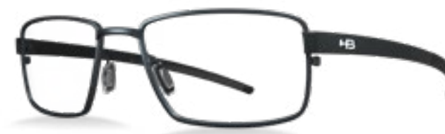
Matte Graphite Yellow Ref. 10100590304010