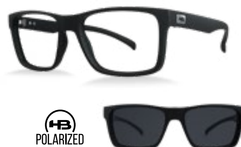
Matte Black Lenses / Blue Chrome Ref. 10103390243033