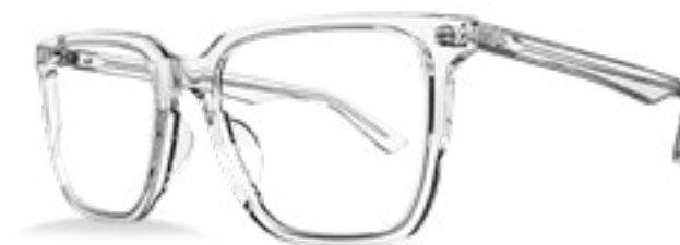
Clear Ref. 10103780087010