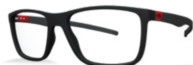
Matte Black D Blue Ref. 10100870003010