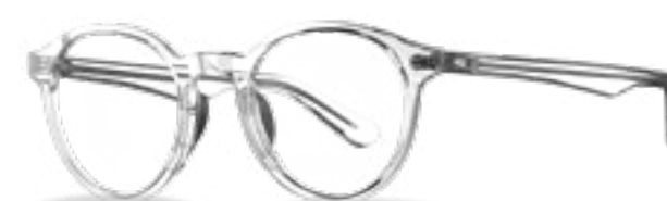
M Ultramarine Demo Ref. 10103970356010