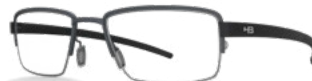
Matte Black Blue Ref. 10100570304010