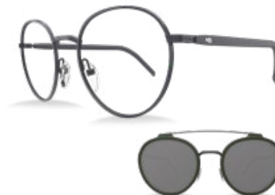
M Graphite Turt G15 / Green Ref. 10104200697006