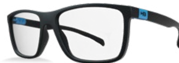
Matte Black D Green Ref. 10100790247010