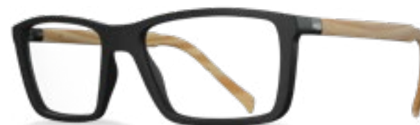
M Black/Wood / Polarized Gray Ref. 10103790261032

Visão nítida e precisa, com proteção total contra raios ultravioleta e atenuação da luz azul danosa.