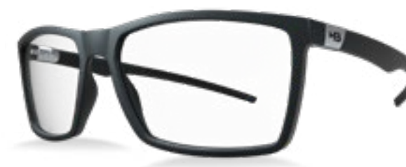
Matte Black D. Blue Ref. 10100760003010