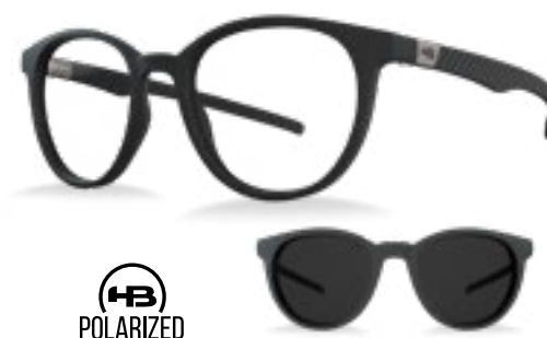
Matte Black D Blue Pol Blue Ref. 10102530003033