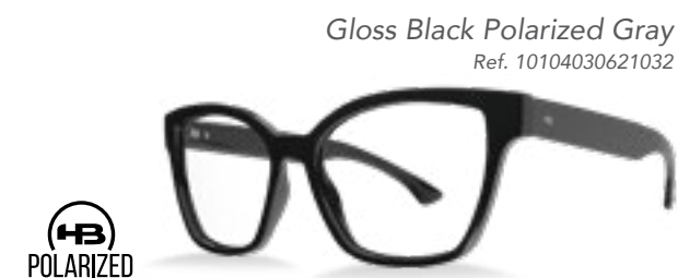
Gloss Black Polarized Gray Ref. 10104030621032