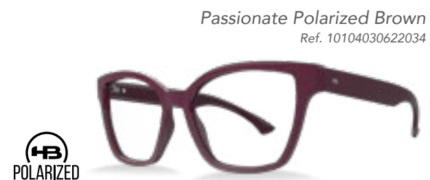
Passionate Polarized Brown Ref. 10104030622034