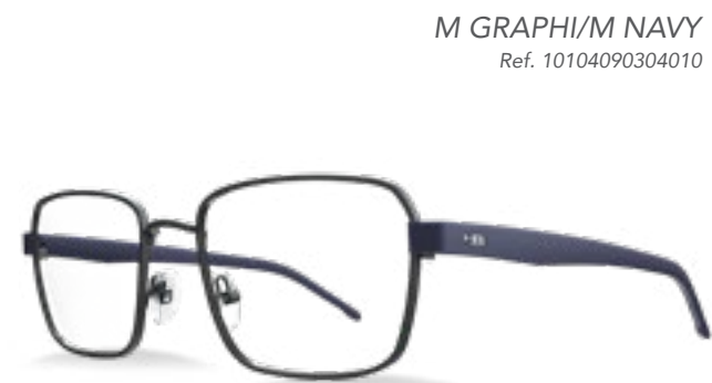
M GRAPHI/M NAVY Ref. 10104090304010