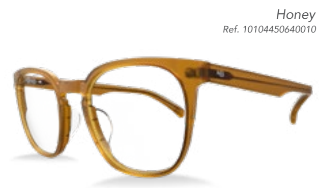
Honey Ref. 10104450640010