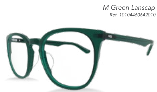
M Green Lanscap Ref. 10104460642010