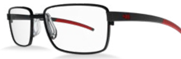
M Graph M Black Ref. 10102850505010