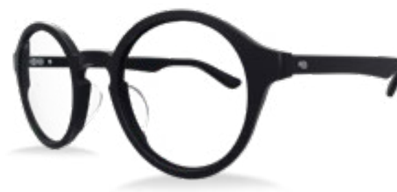
Onyx Ref. 10104430530010