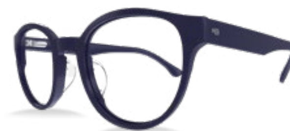
M Night Blue Ref. 10104660699010