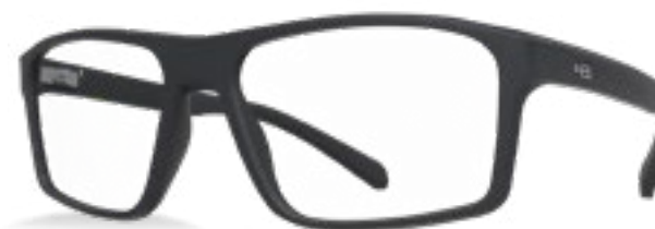
Matte Graphite Ref. 10100010302010