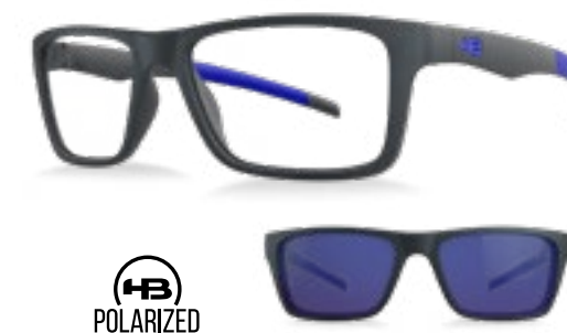
Matte Navy / Polarized Gray Ref. 10101280312032