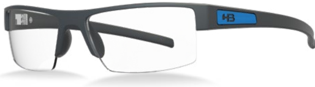
Matte Black Demo Ref. 10103980243010