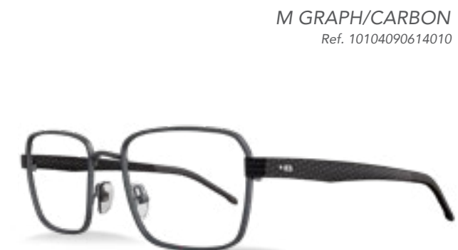
M GRAPH/CARBON Ref. 10104090614010