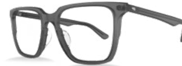
M Smoky Quartz Ref. 10103780352010