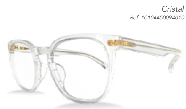
Cristal Ref. 10104450094010