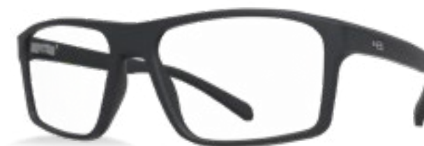
M Fade | Blue M Ref. 10100010553010