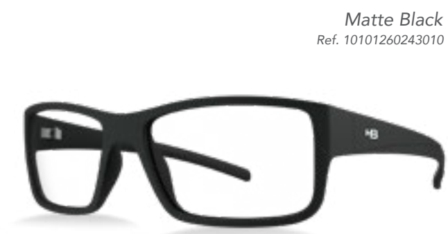
Matte Black Ref. 10101260243010