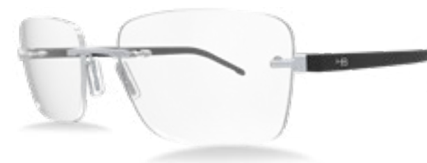
M Grey/M Red Ref. 10104020632010