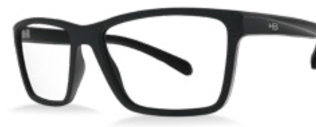
Matte Graphite on Blue Ref. 10103620579010