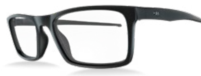
Matte Navy Demo Ref. 10102550312010