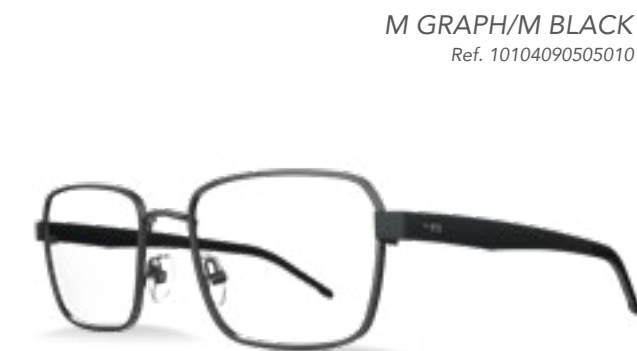
M GRAPH/M BLACK Ref. 10104090505010