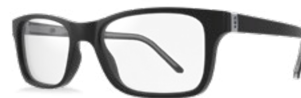
Matte Black Ref. 10104290243010