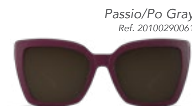
Passio/Po Gray Ref. 20100290061