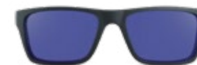
Matte Navy Polarized Gray Ref. 20100040012