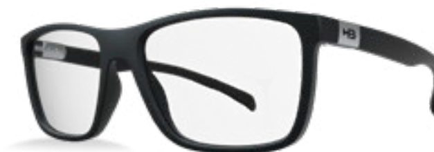
Matte Black D Blue Ref. 10100790003010