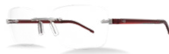
M Grey/Naval B Ref. 10104020633010