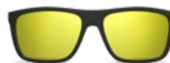
M Black P Blue Ref. 20100260013