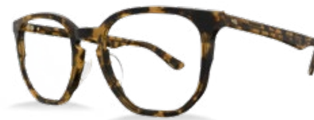
Ma Gl Ultramar Ref. 10103770597010