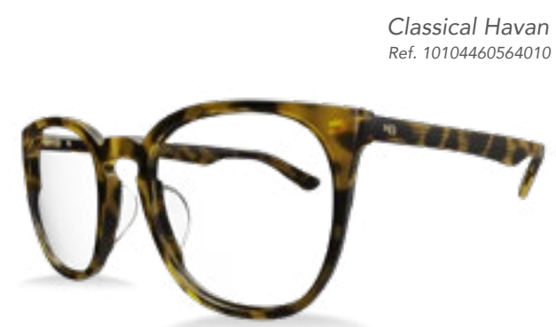
Classical Havan Ref. 10104460564010