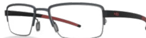
Matte Graphite Yellow Ref. 10100570277010