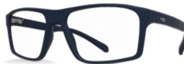
Matte Black Ref. 10100010243010