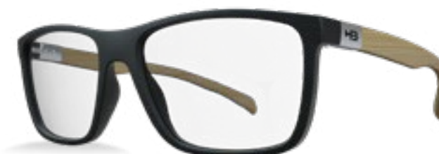
Matte Navy Ref. 10100790312010