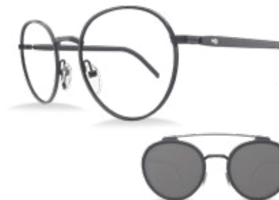
M Graphite Solid / Green Ref. 10104200712032