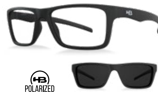
Matte Graphite / Polarized Blue Ref. 10101280302033