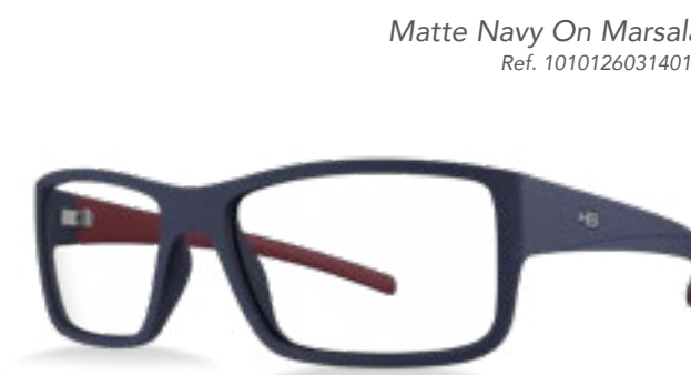
Matte Navy On Marsala Ref. 10101260314010