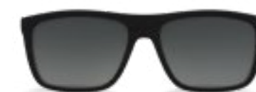
M Black/Red Ref. 20100260675