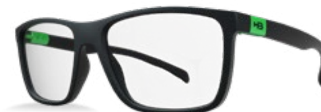
Matte Black Wood Ref. 10100790261010