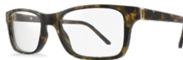
Black Crystal Ref. 10104290006010