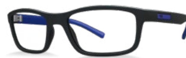
Matte Graphite on Petroleum Ref. 10101000306010