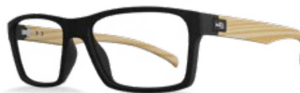
New Graphite On Marsala Ref. 10100930380010