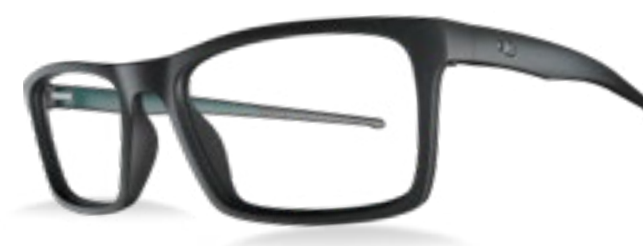
M Onyx / M Black Demo Ref. 10102550345010