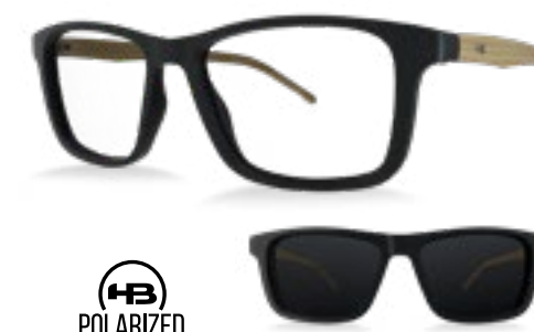
Matte Navy / Polarized Gray Ref. 10103510312032