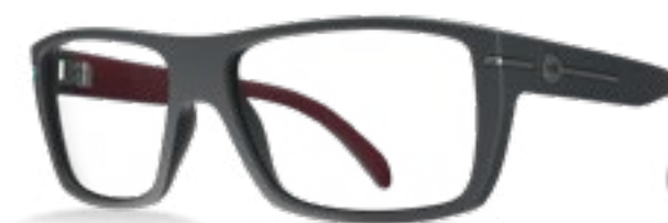
Matte Navy Ref. 10101240312010