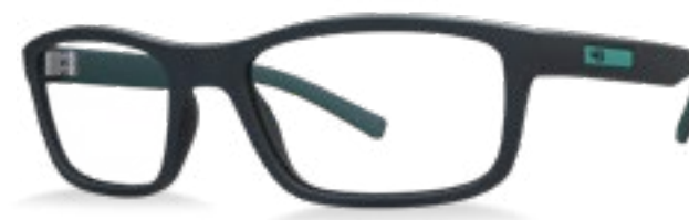
Matte Black on Blue Ref. 10101000254010