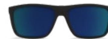
M Black Po Gray Ref. 20100260009