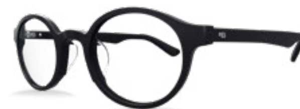
Naval Blue Ref. 10104440629010