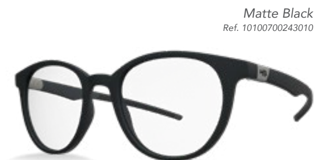
Matte Black Ref. 10100700243010

Hastes em fibra de carbono ultra-resistentes e leves, o que confere a este modelo de alta performance conforto e durabilidade incomparáveis.