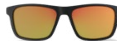
Matte Black P Silver Ref. 20100240015