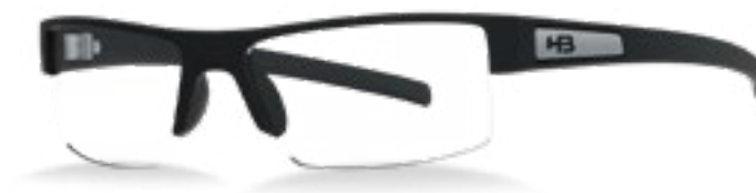
Matte Graphite Demo Ref. 10103980302010