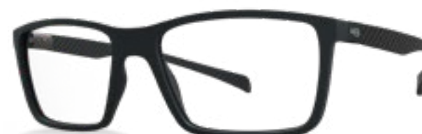
Matte Black Ref. 10100880243010