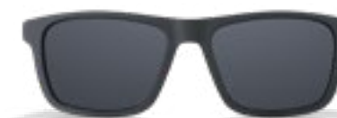
M Navy Silver Ref. 20100240676