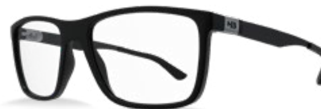
Matte Black Carbon Fiber D Red Ref. 10100870265010