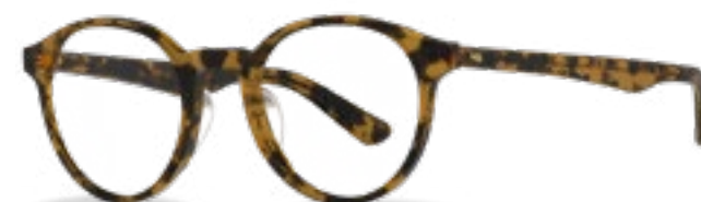
Clear Demo Ref. 10103970087010