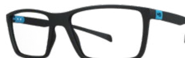
Matte Black Wood Ref. 10100880261010