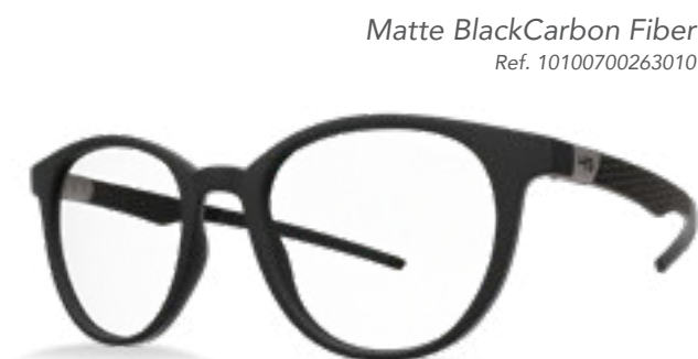
Matte Black Carbon Fiber Ref. 10100700263010