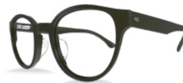
M Black Green Ref. 10104660701010