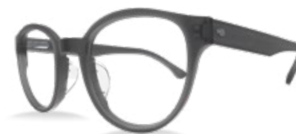
M Shadow Gray Ref. 10104660701010