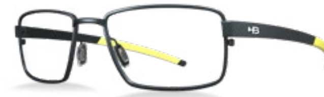
Matte Graphite Red 10100590305010