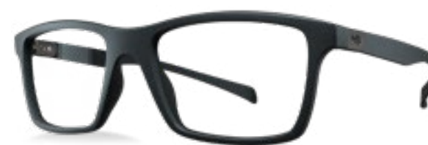
Matte Black Camouflaged Ref. 10100750258010