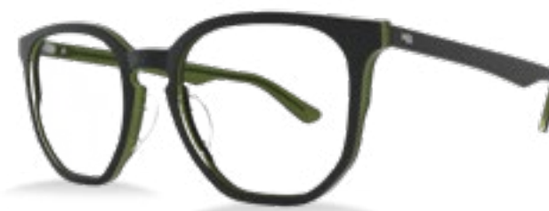
Classical Havan Ref. 10103770564010