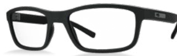
Matte Navy on Marsala Ref. 10101000314010