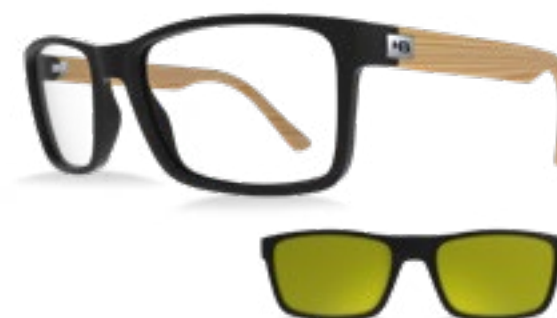
Matte Black / Polarized Gray Ref. 10104200243032