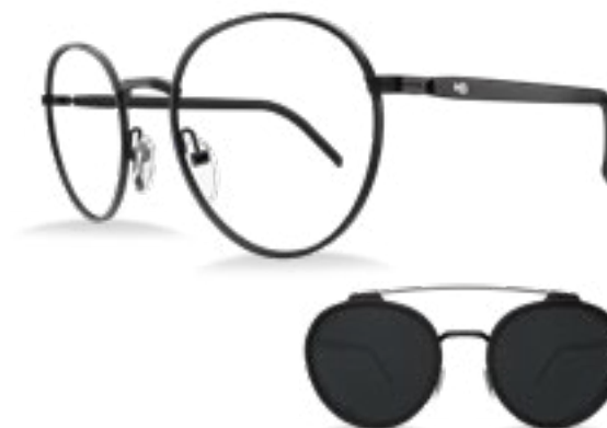
Graphite / Polarized Silver Ref. 10104200696035