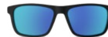
Matte Black P Gray Ref. 20100240009