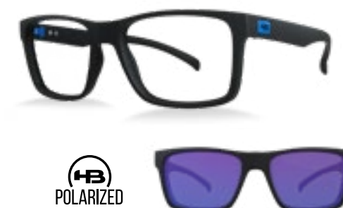
Matte Black Wood Lenses Gray Ref. 10103390261032