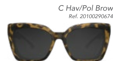
C Hav/Pol Brow Ref. 20100290674