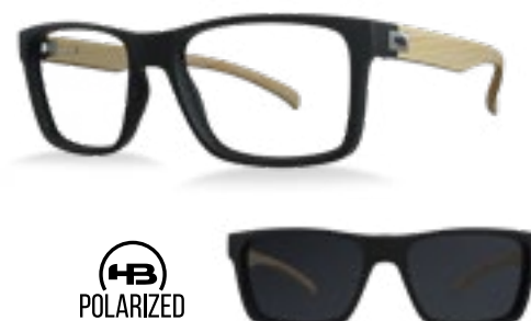
Matte Navy / Lenses Gray Ref. 10103390312032