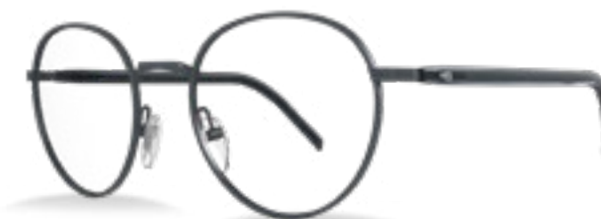
Matte Black Ref. 10103490243010