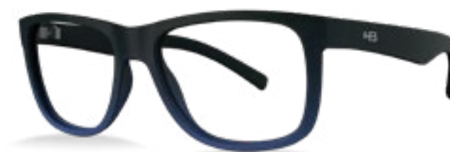
Matte Black Blue Ref. 10100250031010