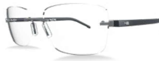
M Grey/M Black Ref. 10104020308010