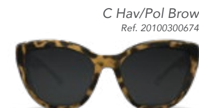
C Hav/Pol Brow Ref. 20100300674