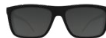
Print Carbon Fi / Polarized Gray Ref. 10103800578032