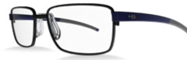
M Black Graph Ref. 10102850277010