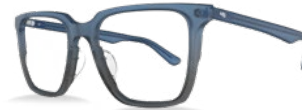
Gra Blue/Onyx Ref. 10103780599010