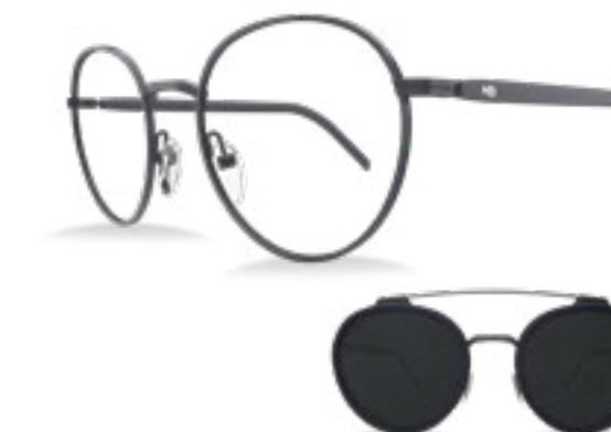
M Black / Polarized Blue Ref. 10104200243033