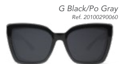
G Black/Po Gray Ref. 20100290060