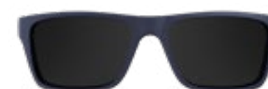
M Black N Drive Ref. 20100040672