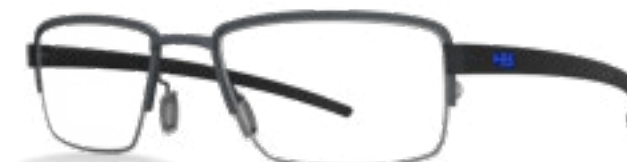
Matte Black Red Ref. 10100570483010