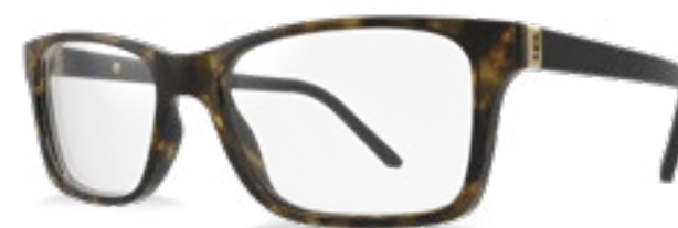
M Green Lanscap Ref. 10104300642010