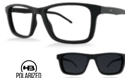
Black Wood / Polarized Gray Ref. 10103510261032