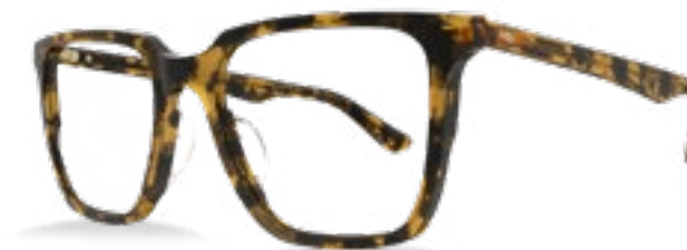
Classical Havan Ref. 10103780564010