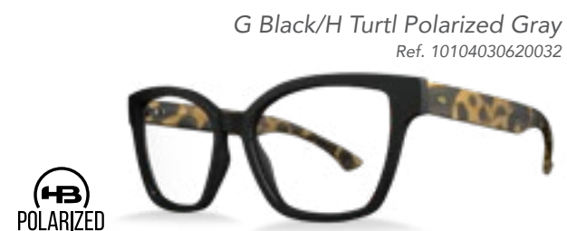
G Black/H Turtl Polarized Gray Ref. 10104030620032

Visão nítida e precisa, com proteção total contra raios ultravioleta e atenuação da luz azul danosa.