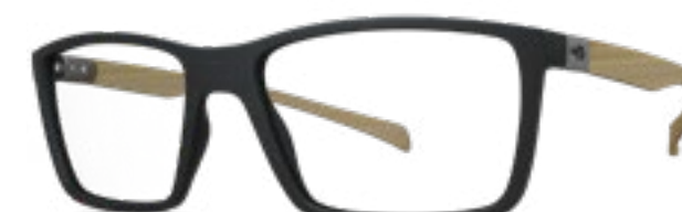
Matte Navy D. Nickel Ref. 10100880517010