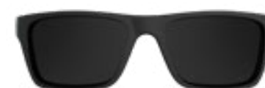
Matte Graphite Polarized Red Ref. 20100040011