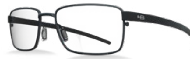
Matte Graphite Navy Ref. 10100580304010