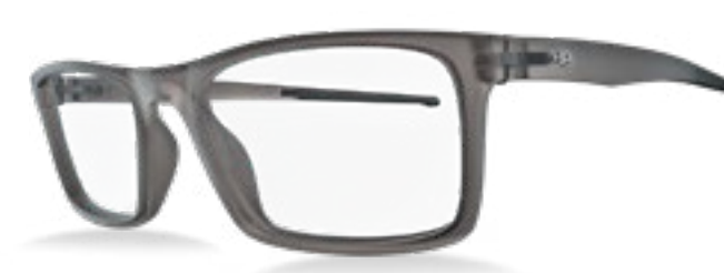
Matte Black Demo Ref. 10102550243010