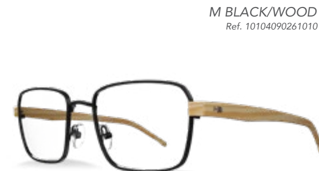
M BLACK/WOOD Ref. 10104090261010