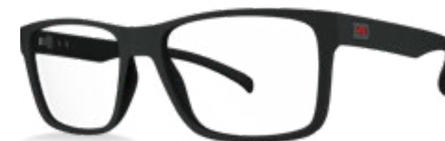
Matte Black / D. White Ref. 10101080252010