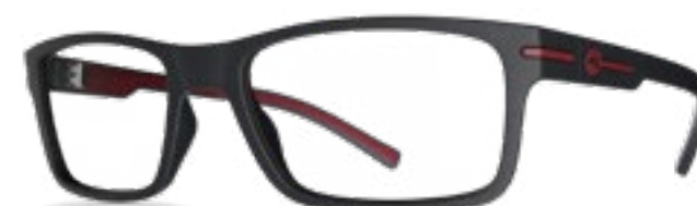
Matte Black Ref. 10100920243010