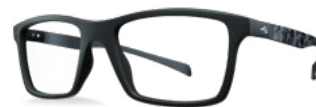
Matte Black D. Blue Ref. 10100750003010