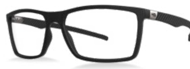
Matte Black Ref. 10100760243010