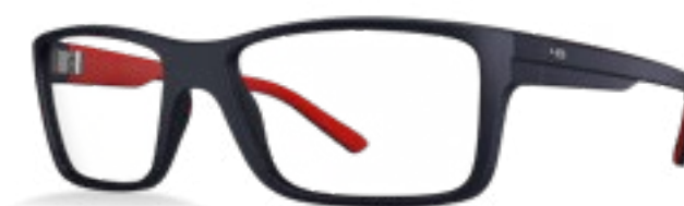
Matte Black Ref. 10101230243010