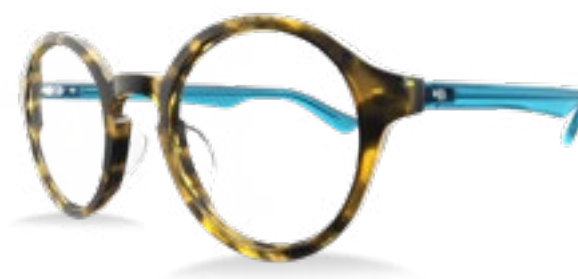
Honey Ref. 10104430640010