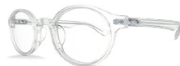
Landscape Green Ref. 10104440630010