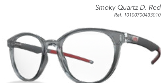
Smoky Quartz D. Red Ref. 10100700433010