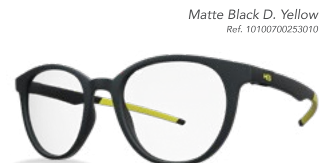
Matte Black D. Yellow Ref. 10100700253010