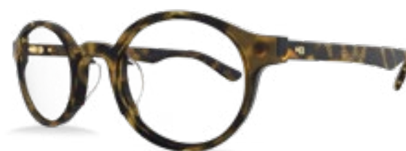
Cristal Ref. 10104440094010