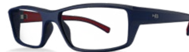
Matte Black Ref. 10101210243010