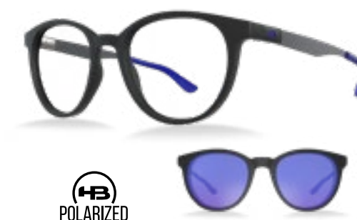
Matte Black Pol Gray Ref. 10102530243032