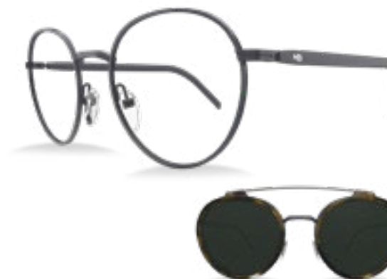
M Graphite / Navy Ref. 10104200304032