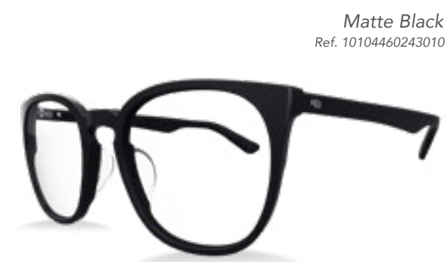
Matte Black Ref. 10104460243010