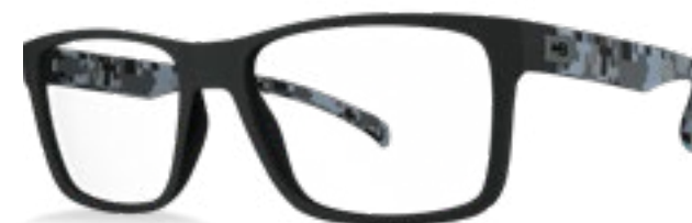
Matte Black D. Graphite Ref. 10101080246010