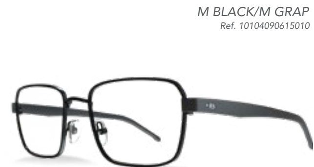
M BLACK/M GRAP Ref. 10104090615010