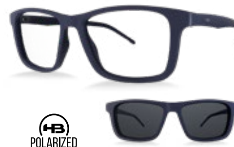
N Carbon Fiber / Polarized Gray Ref. 10103510578032