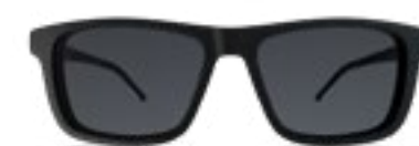
Print Dots Blue / Polarized Gray Ref. 10103800588032