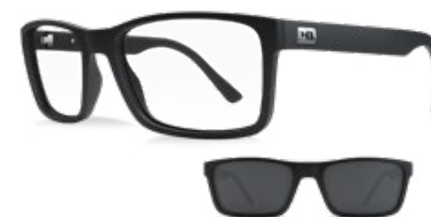
M Black / Gray Night Ref. 10104260243073