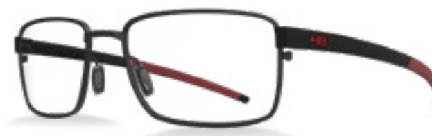
Matte Graphite Black Ref. 10100580483010