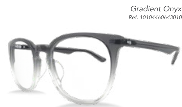
Gradient Onyx Ref. 10104460643010