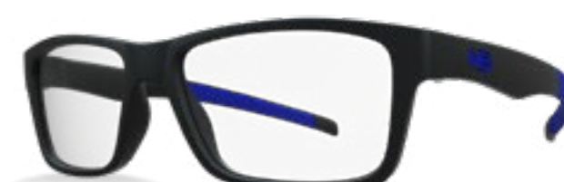
Matte Navy Ref. 10100820312010