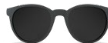
M Grap P Red Ref. 20100080011