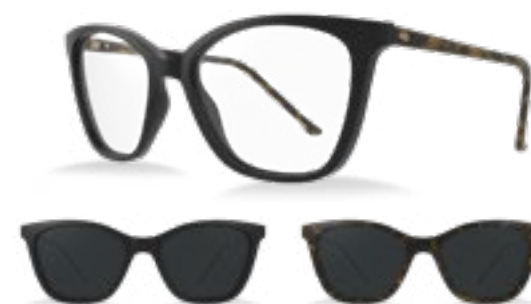
Gloss Black / Black+Havana Polarized Gray Ref. 10103850688032