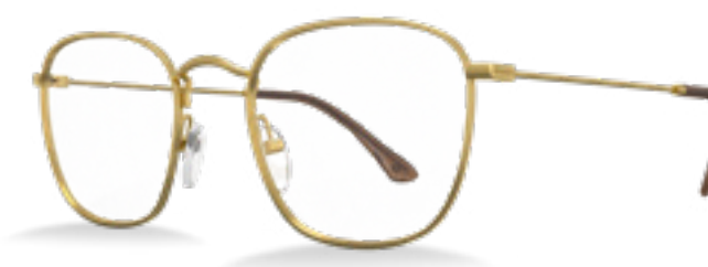
Graphite Ref. 10104500473010