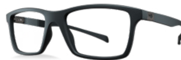
Matte Black Camouflaged Ref. 10100750258010