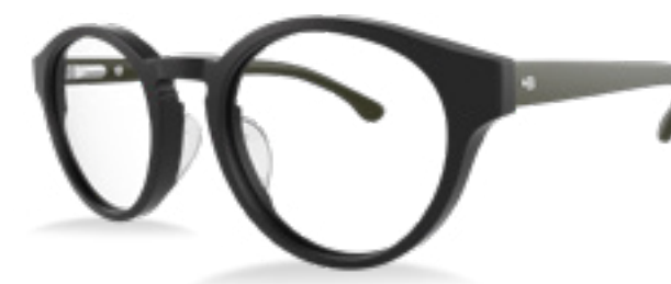
M Night Blue Ref. 10104770699010