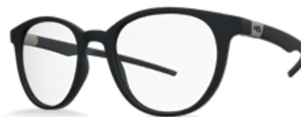
Matte BlackCarbon Fiber Ref. 10100700263010