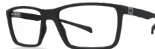
Matte Black D Blue Ref. 10100880003010