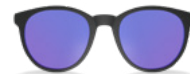
M Black N Drive Ref. 20100080672