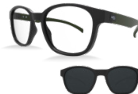
M Navy/Night Bl Gray/Night Drive Ref. 10104480714073