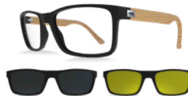
Matte Black / Polarized Gray Ref. 10104260243032