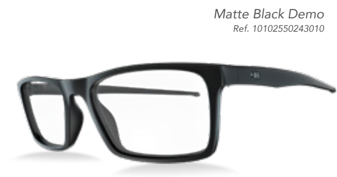
Matte Black Demo Ref. 10102550243010