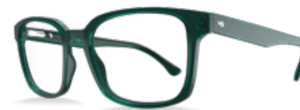
Landscape Green Ref. 10104110630010