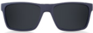
M Black Wood P Gr Ref. 20100140014