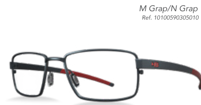
M Grap/N Grap Ref. 10100590305010