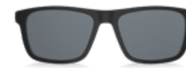
Matte Black Red Ref. 20100240675