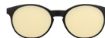
L Royal P Gray Ref. 20100550713