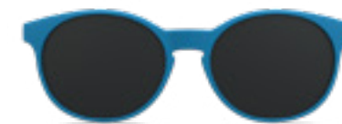
M Black P Blue Ref. 20100550013