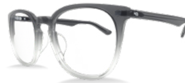
Matte Black Ref. 10104460243010