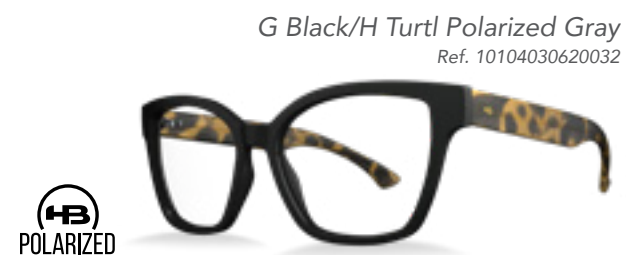
G Black/H Turtl Polarized Gray Ref. 10104030620032

Visão nítida e precisa, com proteção total contra raios ultravioleta e atenuação da luz azul danosa.