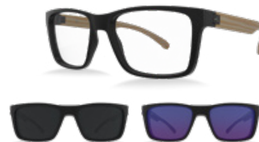
Matte Black Gray/Multi Blue Ref. 10104720243074