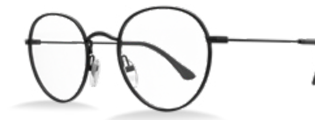
Gold Ref. 10104510164010