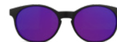
M Black Po Gray Ref. 20100550009