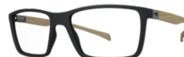
Matte Navy D. Nickel Ref. 10100880517010