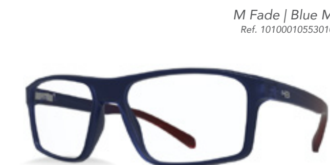
M Fade | Blue M Ref. 10100010553010