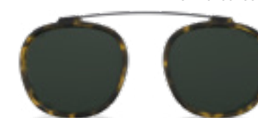
M Solid G Gray Ref. 20100480704