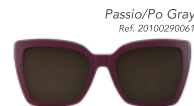
Passio/Po Gray Ref. 20100290061