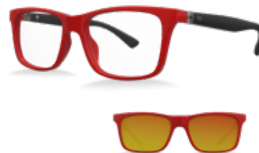
M Grap/ M S Green Polarized Gray Ref. 10104810735032