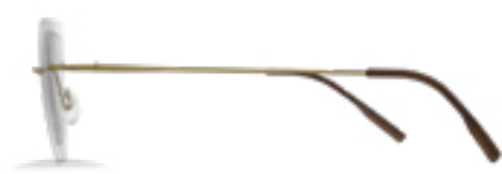
Gold Ref. 10105110164010