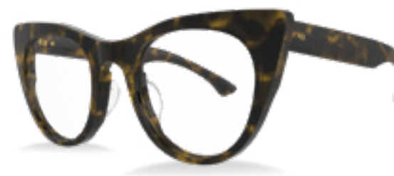
Nude/Havan Turt Ref. 10104950567010