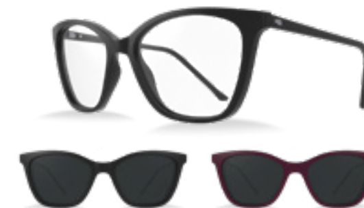
Passionate / Pas + Black Polarized Brown Ref. 10103850689034