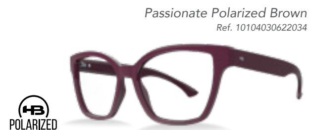
Passionate Polarized Brown Ref. 10104030622034