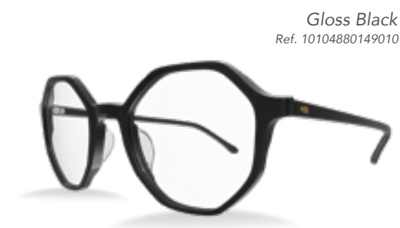
Gloss Black Ref. 10104880149010