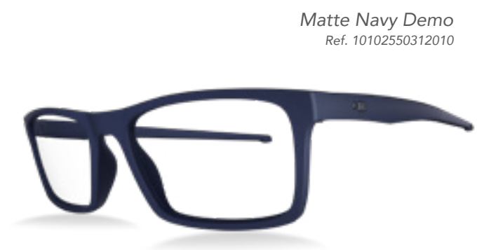
Matte Navy Demo Ref. 10102550312010