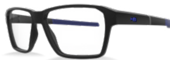
M NIGHT BLUE Ref. 10104590699010