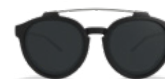
M Hav Turt G15 Ref. 20100510702