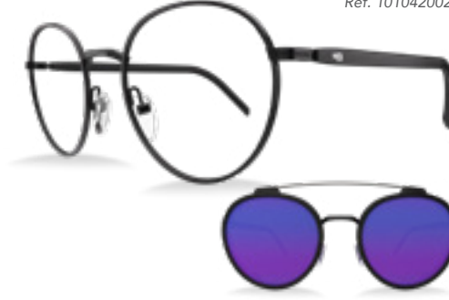
M Graphite / Navy Ref. 10104200304032