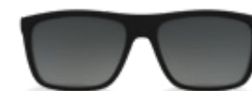
M Black/Red Ref. 20100260675