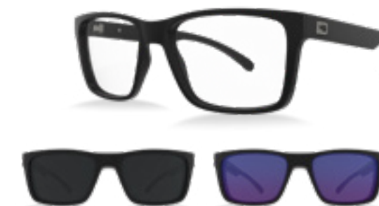
Matte Black Gray/Night Driv Ref. 10104720243073