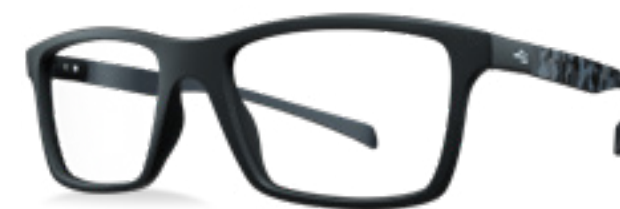
Matte Black D. Blue Ref. 10100750003010