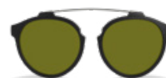
M Black P Blue Ref. 20100510013