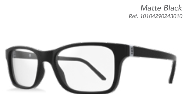
Matte Black Ref. 10104290243010

Dobradiças exclusivas, maior resistência.