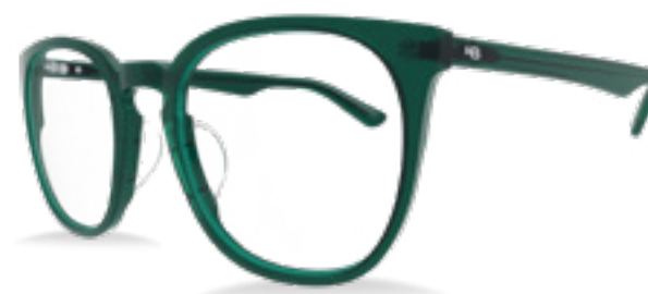
Gradient Onyx Ref. 10104460643010