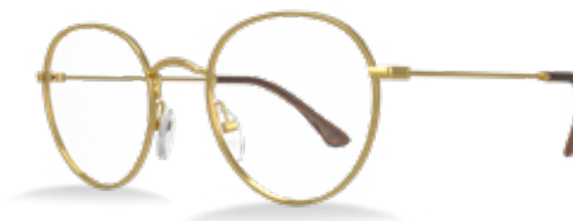
Graphite Ref. 10104510473010