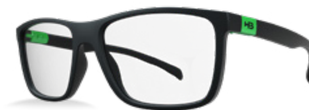
Matte Navy Ref. 10100790312010