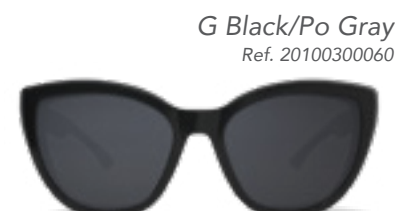
G Black/Po Gray Ref. 20100300060