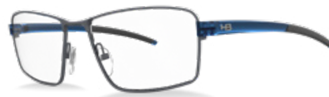
M Black/Onyx Ref. 10104270634010