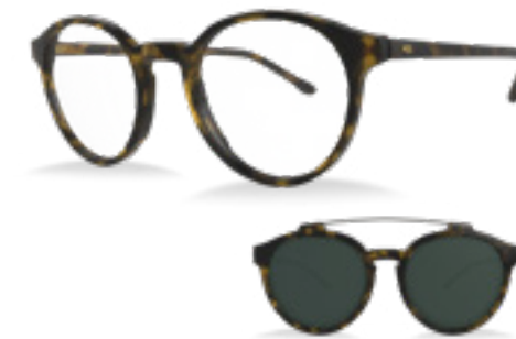
M Ultramarine / Polarized Gray Ref. 10104920356032