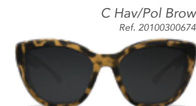
C Hav/Pol Brow Ref. 20100300674