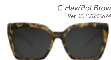
C Hav/Pol Brow Ref. 20100290674