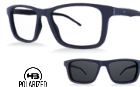
N Carbon Fiber / Polarized Gray Ref. 10103510578032