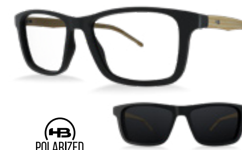
Matte Navy / Polarized Gray Ref. 10103510312032