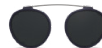
M Solid Green P Gray Ref. 20100360704