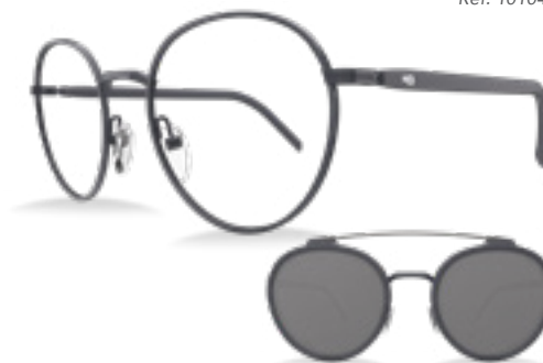
M Graphite Solid / Green Ref. 10104200712032