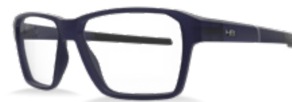
MATTE BLACK Ref. 10104590243010