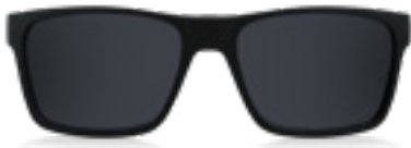
M Black P Blue Ref. 20100140013