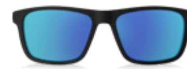
Matte Black P Gray Ref. 20100240009