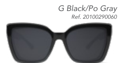
G Black/Po Gray Ref. 20100290060