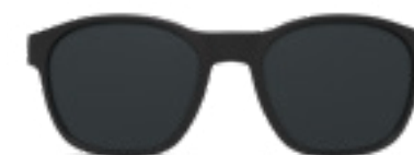
M Navy P Gray Ref. 20100470012