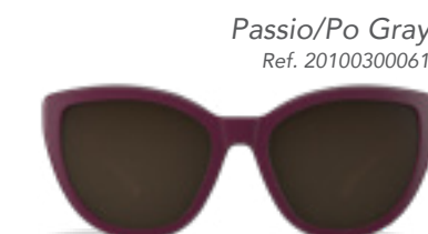
Passio/Po Gray Ref. 20100300061