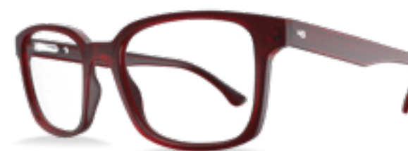
Matte Red Ref. 10104110628010