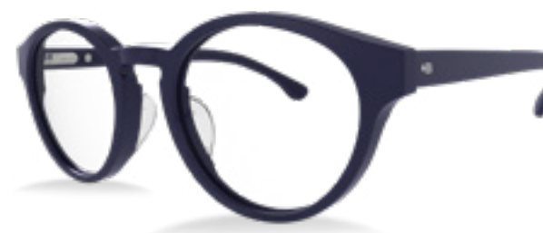
Matte Black Ref. 10104770243010