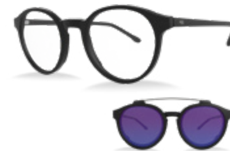
Matte Black / Polarized Gray Ref. 10104920243032