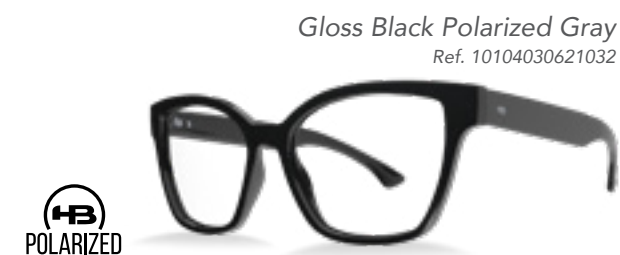
Gloss Black Polarized Gray Ref. 10104030621032