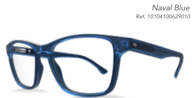
Naval Blue Ref. 10104100629010