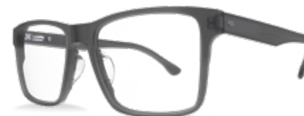
Matte Green Pickle Ref. 10104580700010