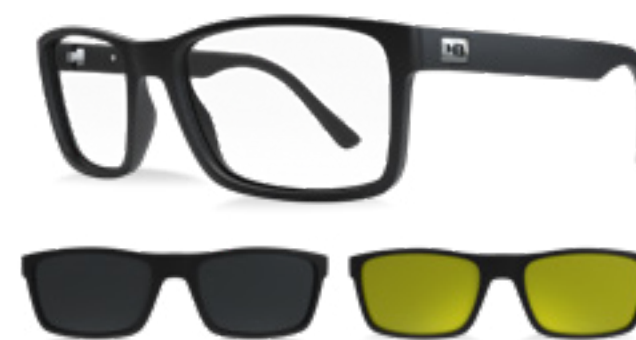
M Navy / Polarized Gray Ref. 10104260312032