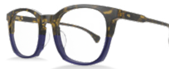
Gra Nude Crysta Ref. 10104940572010