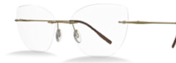
Nickel Ref. 10105110513010