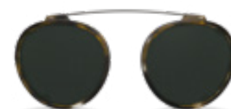
M Navy P Gray Ref. 20100360012