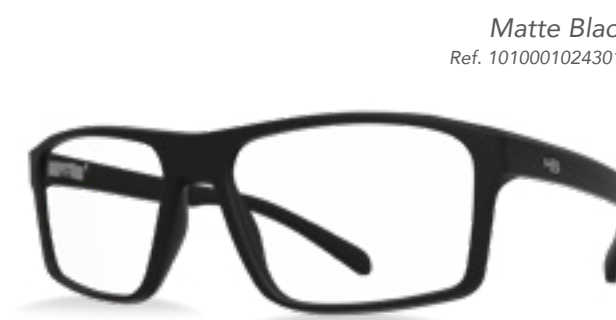
Matte Black Ref. 10100010243010