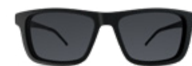
Print Dots Blue / Polarized Gray Ref. 10103800588032