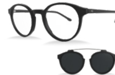
Matte Onyx / Polariz Silver Ref. 10104920335035