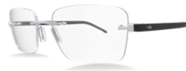
M Grey/M Red Ref. 10104020632010