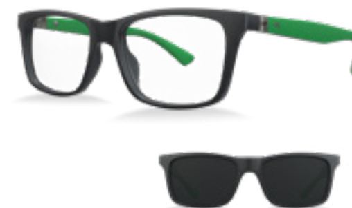
Matte Black Gray/Gamer Ref. 10104810243092