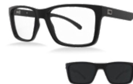
M Naval Blue Gray/Silver Ref. 10104720722091