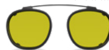
M Black P Blue Ref. 20100480013