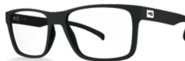
Matte Black Wood Ref. 10101080261010