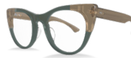
Classical Havan Ref. 10104950564010