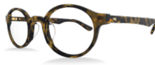
Classical Havan Ref. 10104440564010