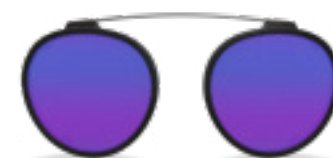
M Black Red Ref. 20100360675