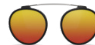
M Grap P Silver Ref. 20100360015