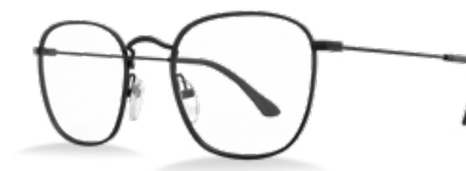
Gold Ref. 10104500164010