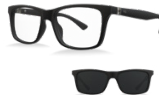
Matte Navy Polarized Gray Ref. 10104810312032