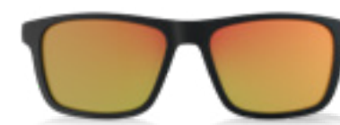
Matte Black P Silver Ref. 20100240015