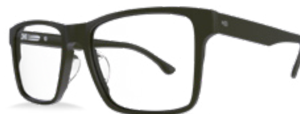
Matte Black Ref. 10104580243010