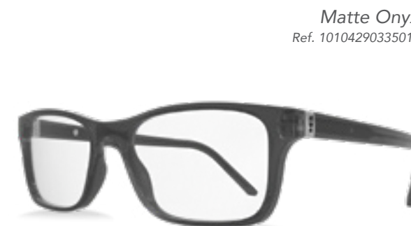
Matte Onyx Ref. 10104290335010