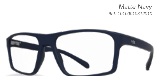
Matte Navy Ref. 10100010312010