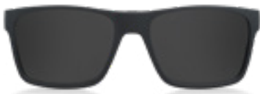
M Navy P Gray Ref. 20100140012