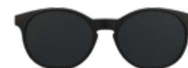
M Black Po Gray Ref. 20100550009