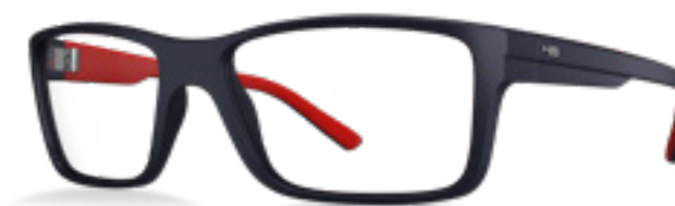
Matte Fade Invert Onyx I Olive Ref. 10101230485010