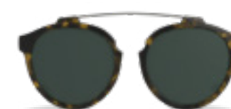
M Ult Ma P Gray Ref. 20100510707