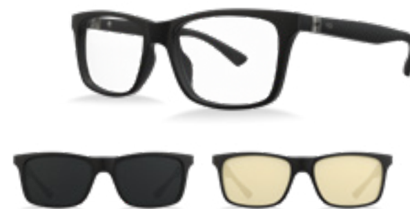
Matte Black Polarized Gray Ref. 10104810243032