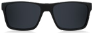
M Black N Drive Ref. 20100140672