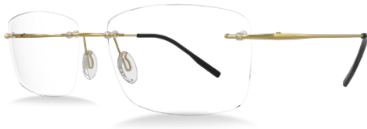
Gold Ref. 10104320164010