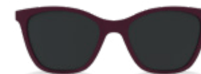
Hav/Pol Brow Ref. 20100330674