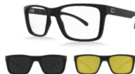
Matte Black Polarized Gray Ref. 10104720243032