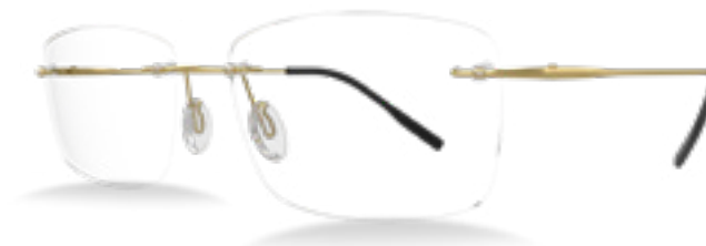
Nickel Ref. 10104320513010