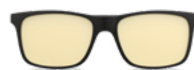
M Black Po Gray Ref. 20100560009