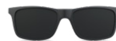
M Navy P Gray Ref. 20100560012