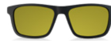
Matte Black P Blue Ref. 20100240013