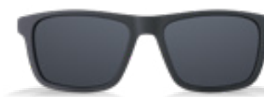
M Navy Silver Ref. 20100240676