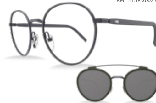
M Black / Polarized Blue Ref. 10104200243033