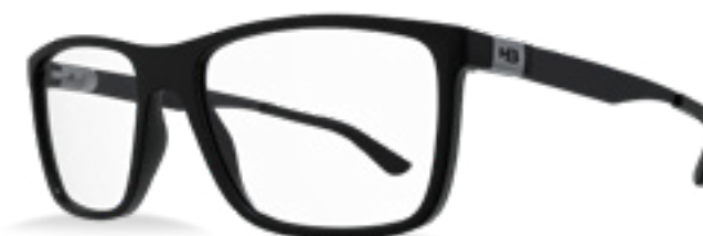
Matte Black Carbon Fiber D Red Ref. 10100870265010