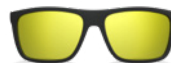
M Black P Blue Ref. 20100260013