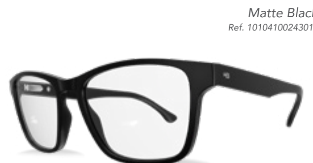
Matte Black Ref. 10104100243010