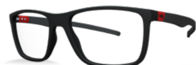
Matte Black Carbon Fiber Ref. 10100870263010