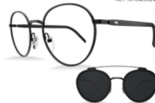
Graphite / Polarized Silver Ref. 10104200696035