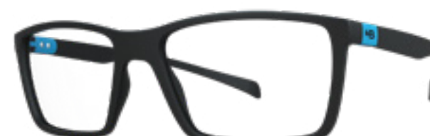
Matte Black Wood Ref. 10100880261010