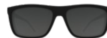
Print Carbon Fi / Polarized Gray Ref. 10103800578032