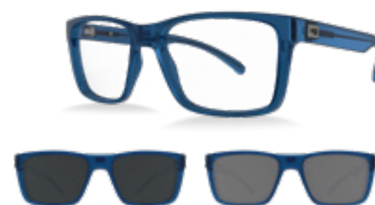
Print Carbon Fi Polarized Gray Ref. 10104720578032