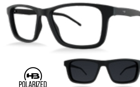
Black Wood / Polarized Gray Ref. 10103510261032