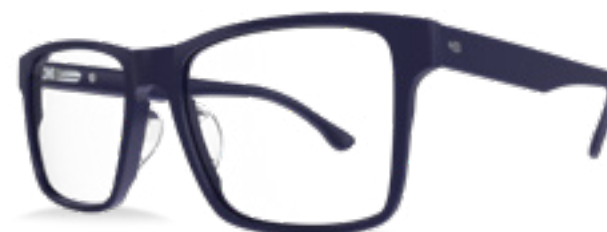
M Shadow Gray Ref. 10104580701010