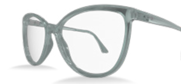
Havana Turtle Ref. 10104840214010