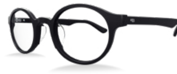
Matte Black Ref. 10104440243010