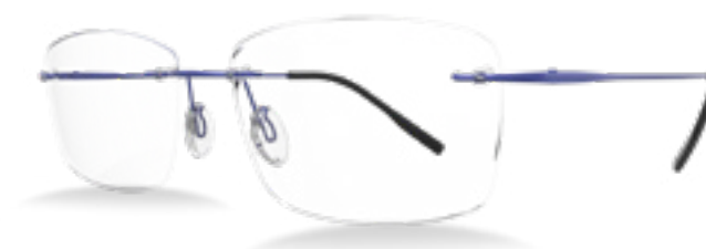
Matte Blue Ref. 10104320600010