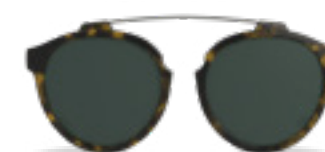
M Ult Ma P Gray Ref. 20100510707