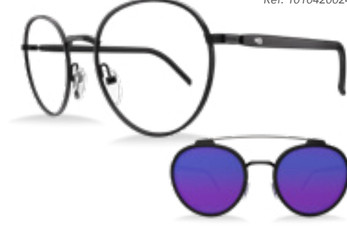
M Graphite / Navy Ref. 10104200304032