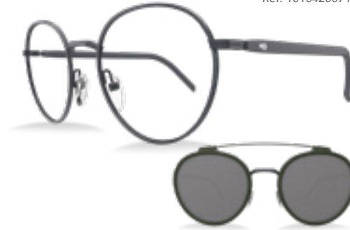
M Black / Polarized Blue Ref. 10104200243033