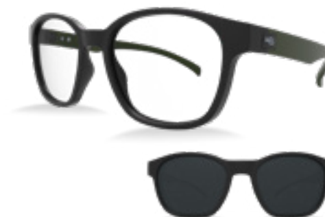
M Navy/Night Bl Gray/Night Drive Ref. 10104480714073