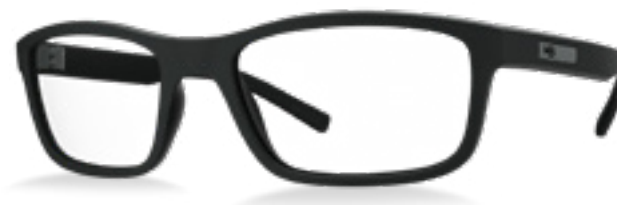
Matte Navy on Marsala Ref. 10101000314010