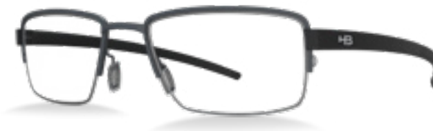
Matte Graphite Yellow Ref. 10100570277010