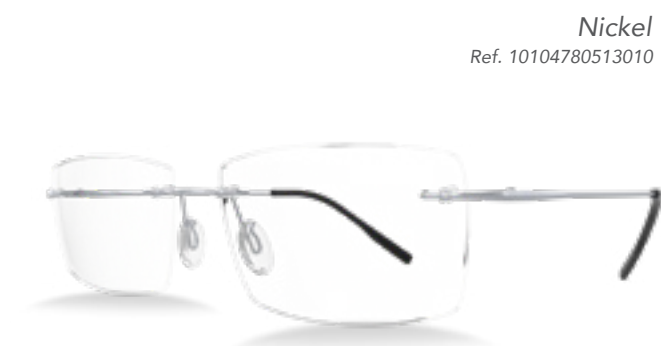
Nickel Ref. 10104780513010