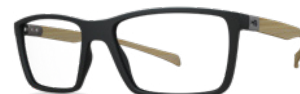
Matte Navy D. Nickel Ref. 10100880517010