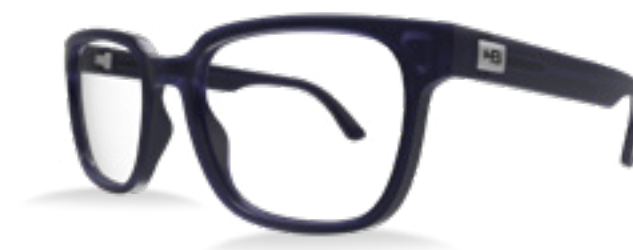
M Shadow Gray Ref. 10104490701010