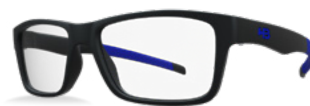
Matte Navy Ref. 10100820312010