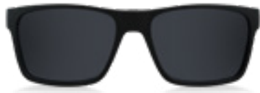
M Black P Blue Ref. 20100140013