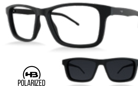
Black Wood / Polarized Gray Ref. 10103510261032