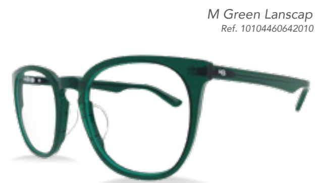
M Green Lanscap Ref. 10104460642010