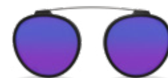
M Black Red Ref. 20100360675