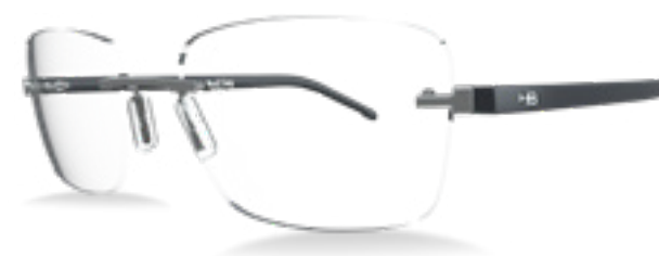
M Grey/M Black Ref. 10104020308010