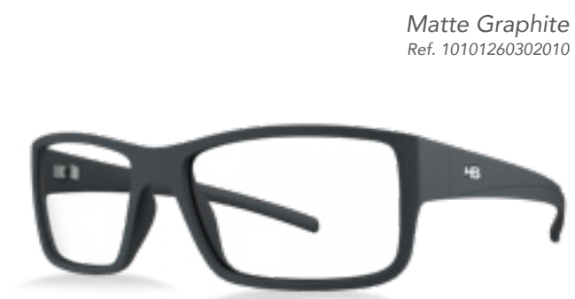
Matte Graphite Ref. 10101260302010