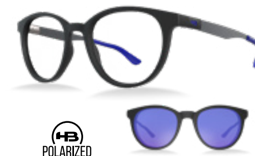
Matte Black Pol Gray Ref. 10102530243032