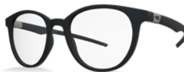
Matte BlackCarbon Fiber Ref. 10100700263010