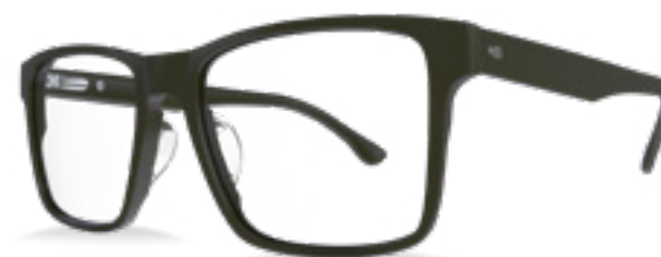
Matte Black Ref. 10104580243010