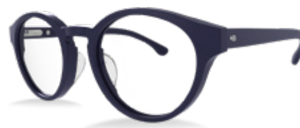
Matte Black Ref. 10104770243010