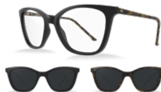
Gloss Black / Black+Havana Polarized Gray Ref. 10103850688032