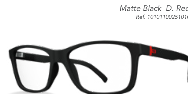
Matte Black D. Red Ref. 10101100251010