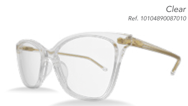
Clear Ref. 10104890087010