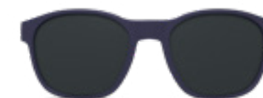
M Black N Drive Ref. 20100470672