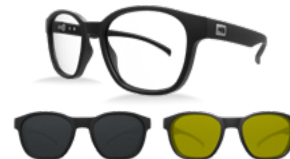
Matte Black / Polarized Gray Ref. 10104480243032