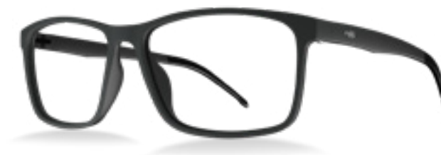
New Graphite Demo Ref. 10102790377010