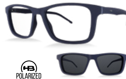
N Carbon Fiber / Polarized Gray Ref. 10103510578032