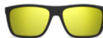
M Black P Blue Ref. 20100260013