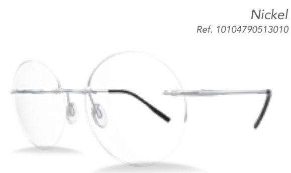
Nickel Ref. 10104790513010