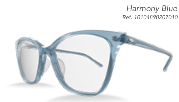
Harmony Blue Ref. 10104890207010