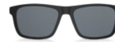
Matte Black Red Ref. 20100240675