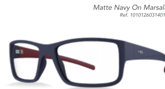
Matte Navy On Marsala Ref. 10101260314010