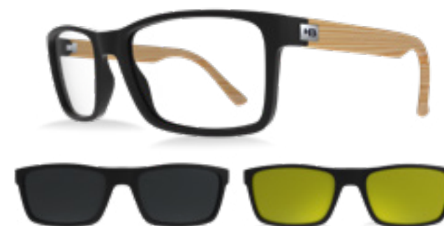
Matte Black / Polarized Gray Ref. 10104260243032