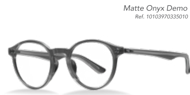
Matte Onyx Demo Ref. 10103970335010