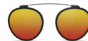
M Grap P Silver Ref. 20100360015