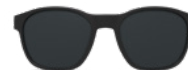
M Navy P Gray Ref. 20100470012