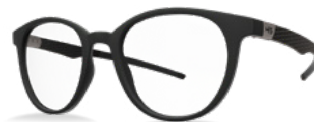
Smoky Quartz D. Red Ref. 10100700433010