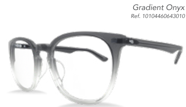
Gradient Onyx Ref. 10104460643010