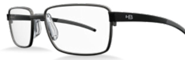
M Black M Navy Ref. 10102850563010