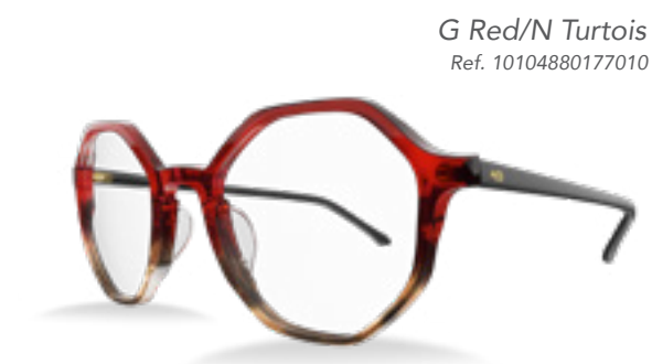
G Red/N Turtois Ref. 10104880177010