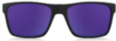
M Grap P Silver Ref. 20100140015