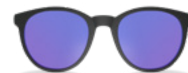
M Black N Drive Ref. 20100080672