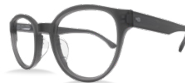
Matte Shadow Gray Ref. 10104660701010