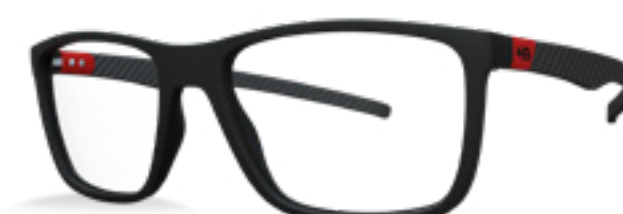
Matte Black Carbon Fiber Ref. 10100870263010