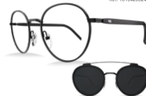
Graphite / Polarized Silver Ref. 10104200696035