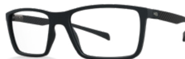
Matte Black Ref. 10100880243010