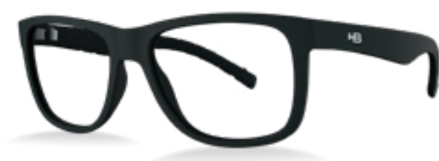
Matte Black Red Ref. 10100250279010