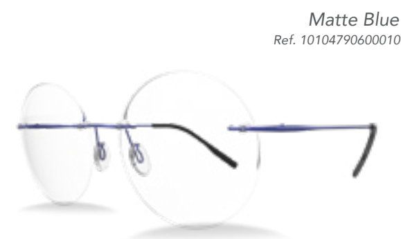
Matte Blue Ref. 10104790600010