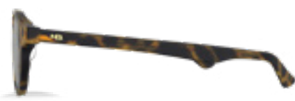
Classical Havan Ref. 10104440564010