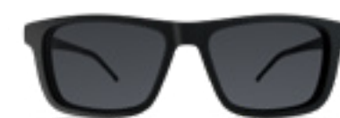
Print Dots Blue / Polarized Gray Ref. 10103800588032