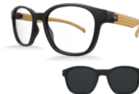
M Black/S Green Polarized Gray Ref. 10104480715032