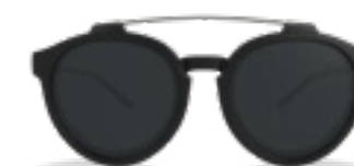
M Hav Turt G15 Ref. 20100510702