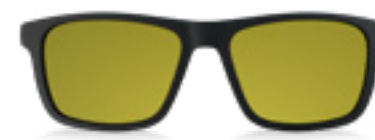
Matte Black P Blue Ref. 20100240013