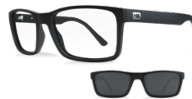
M Black / Gray Night Ref. 10104260243073