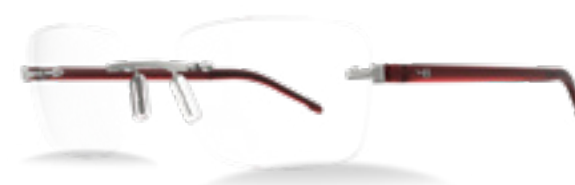
M Grey/Naval B Ref. 10104020633010