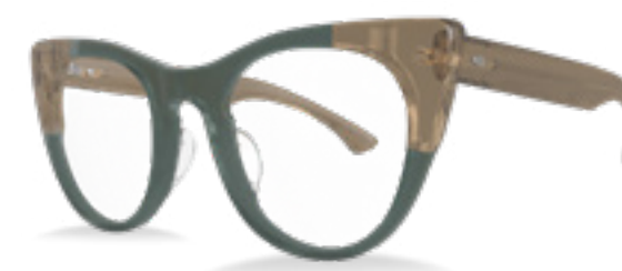
Classical Havan Ref. 10104950564010