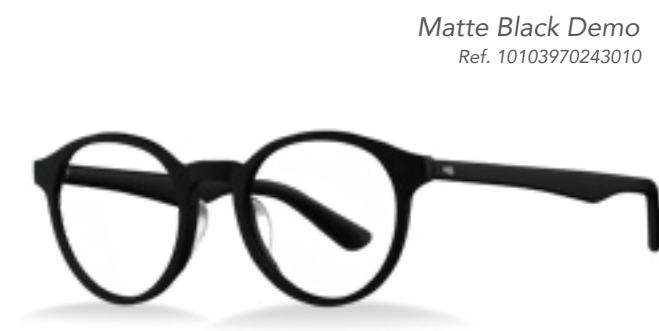
Matte Black Demo Ref. 10103970243010