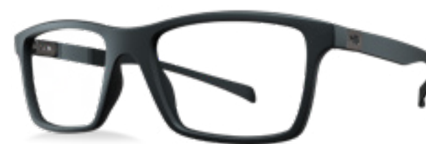
Matte Black Camouflaged Ref. 10100750258010