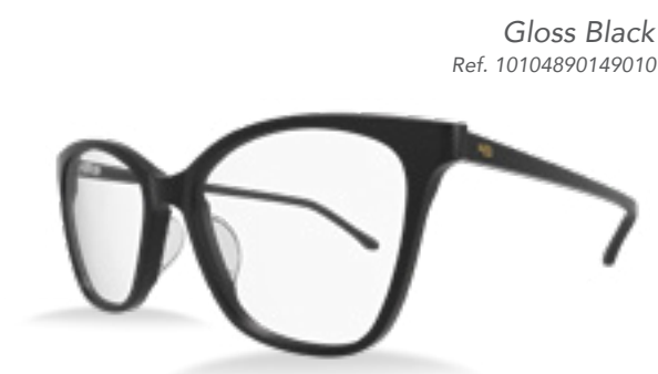
Gloss Black Ref. 10104890149010