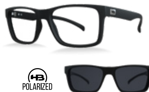
Matte Black Polarized Blue Ref. 10103390243033