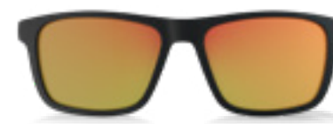
Matte Black P Silver Ref. 20100240015