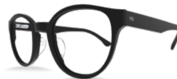
Matte Black Ref. 10104660243010