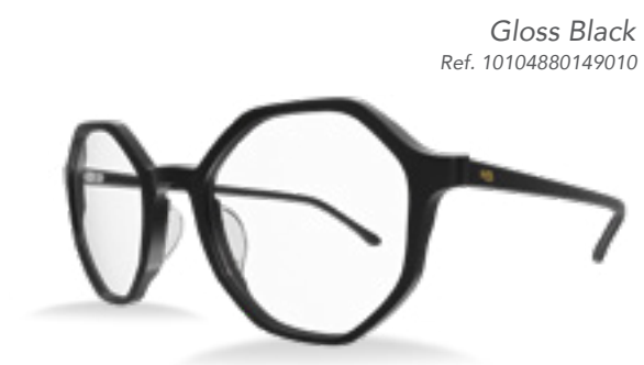
Gloss Black Ref. 10104880149010