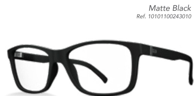
Matte Black Ref. 10101100243010