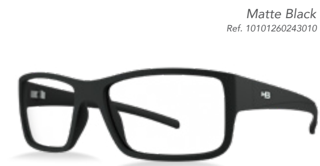
Matte Black Ref. 10101260243010