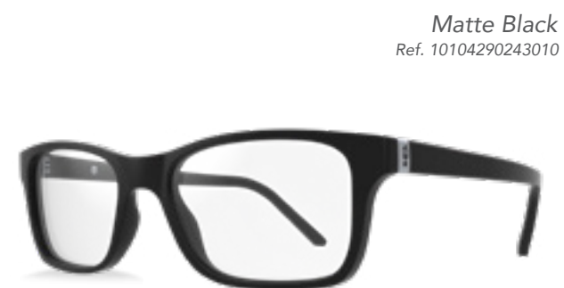
Matte Black Ref. 10104290243010

Dobradiças exclusivas, maior resistência.