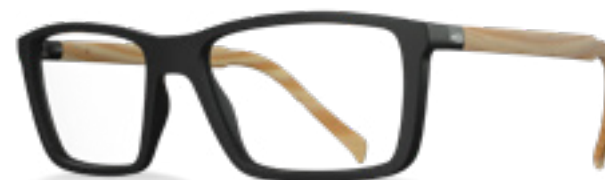
M Black/Wood / Polarized Gray Ref. 10103790261032

Visão nítida e precisa, com proteção total contra raios ultravioleta e atenuação da luz azul danosa.