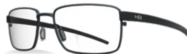
Matte Graphite Navy Ref. 10100580304010