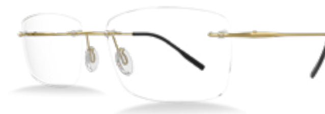
Gold Ref. 10104320164010