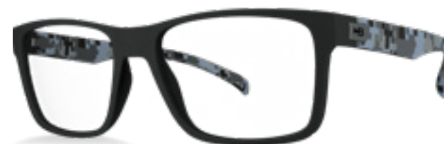
Matte Black D. Graphite Ref. 10101080246010