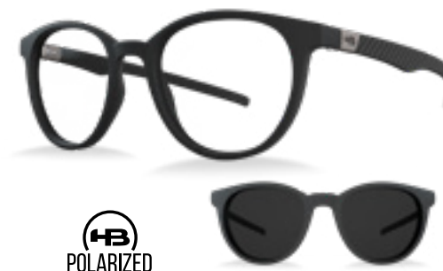
Matte Black D Blue Pol Blue Ref. 10102530003033