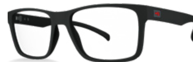
Matte Black / D. White Ref. 10101080252010