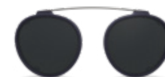
M Solid Green P Gray Ref. 20100360704