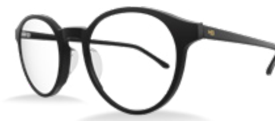
Matte Steel Blue/Pink Ref. 10104870720010