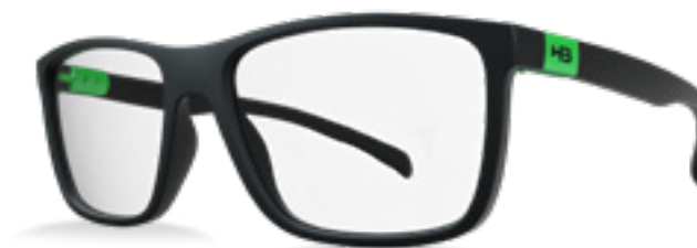
Matte Navy Ref. 10100790312010