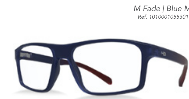
M Fade | Blue M Ref. 10100010553010