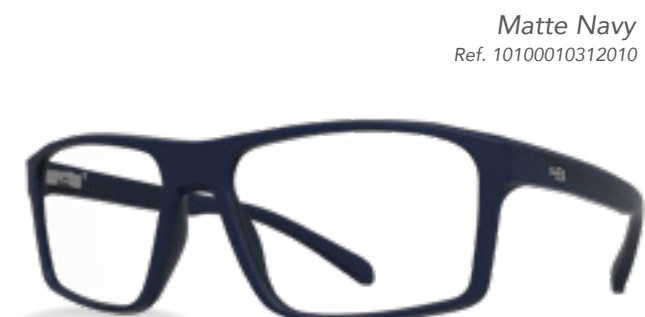
Matte Navy Ref. 10100010312010