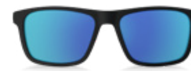
Matte Black P Gray Ref. 20100240009