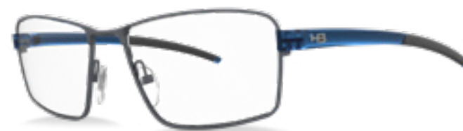
M Black/Onyx Ref. 10104270634010