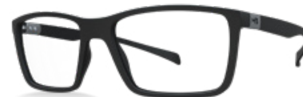
Matte Black D Blue Ref. 10100880003010