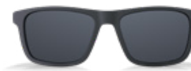
M Navy Silver Ref. 20100240676