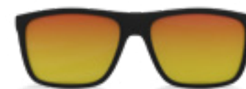
M Black Silver Ref. 20100260671