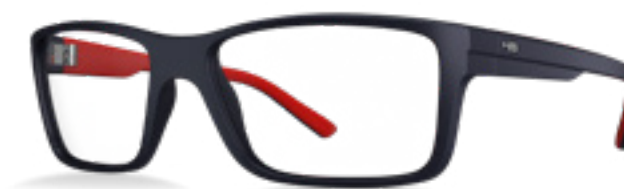
Matte Fade Invert Onyx I Olive Ref. 10101230485010