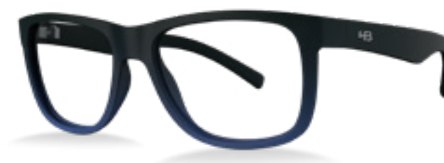
Matte Black Blue Ref. 10100250031010