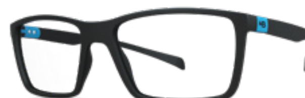
Matte Black Wood Ref. 10100880261010