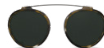
M Navy P Gray Ref. 20100360012