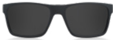
M Navy P Gray Ref. 20100140012