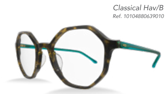
Classical Hav/B Ref. 10104880639010