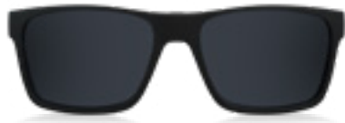
M Black N Drive Ref. 20100140672