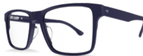
M Shadow Gray Ref. 10104580701010