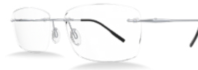
Nickel Ref. 10104320513010