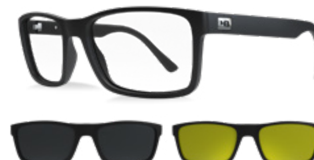
M Navy / Polarized Gray Ref. 10104260312032