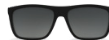
M Black/Red Ref. 20100260675