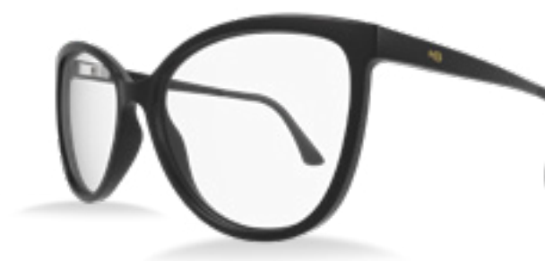
Green Shades Ref. 10104840206010