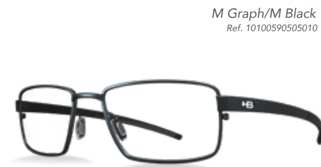
M Graph/M Black Ref. 10100590505010