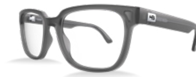
Matte Black Ref. 10104490243010