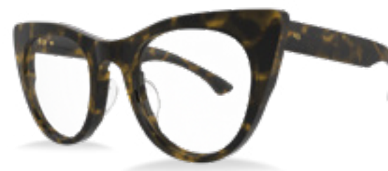
Nude/Havan Turt Ref. 10104950567010