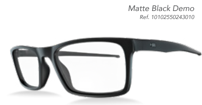
Matte Black Demo Ref. 10102550243010