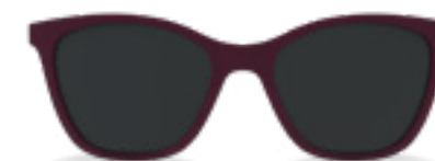
Hav/Pol Brow Ref. 20100330674