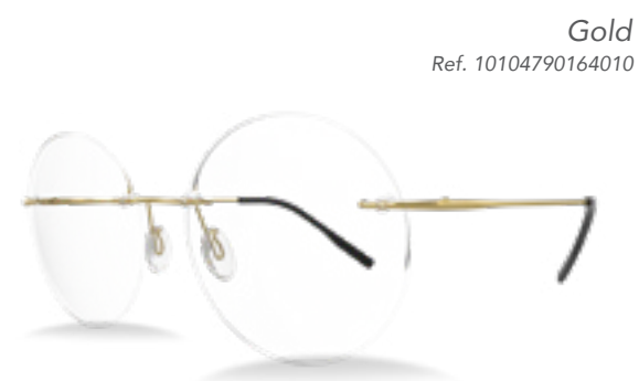
Gold Ref. 10104790164010