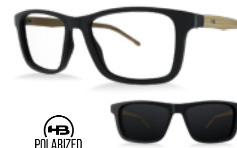
Matte Navy / Polarized Gray Ref. 10103510312032