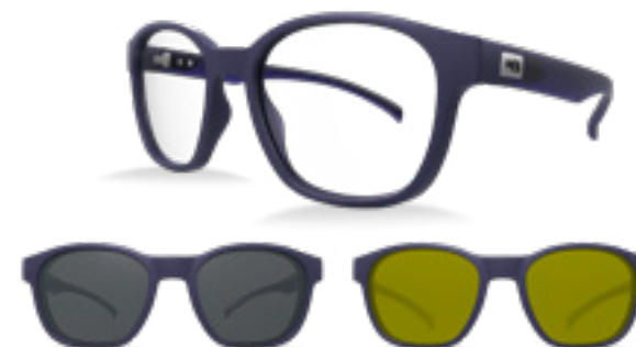
Matte Black Gray Night Drive Ref. 10104480243073