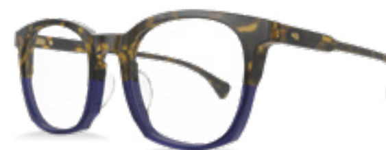
Gra Nude Crysta Ref. 10104940572010