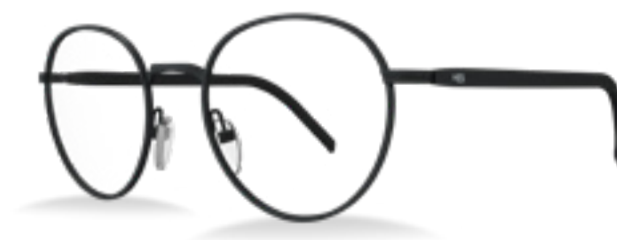
Matte Graphite Ref. 10103490302010