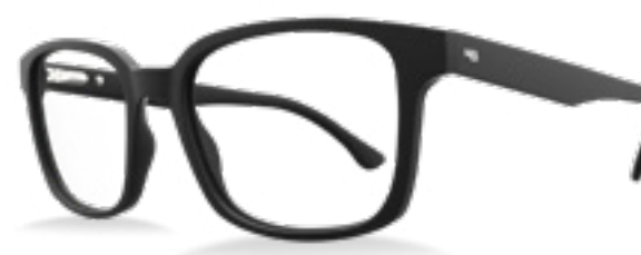
Landscape Green Ref. 10104110630010