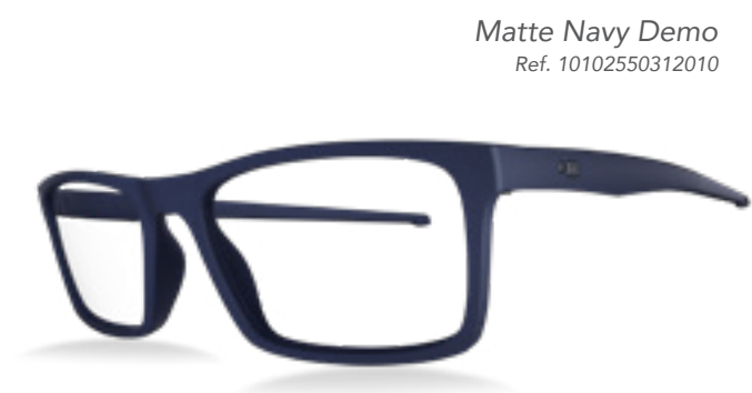
Matte Navy Demo Ref. 10102550312010