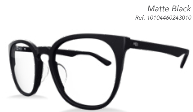
Matte Black Ref. 10104460243010