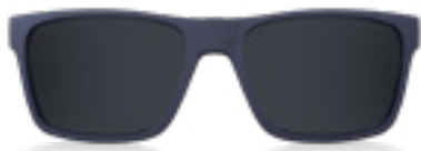
M Black Wood P Gr Ref. 20100140014