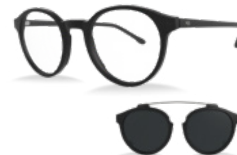
Matte Onyx / Polariz Silver Ref. 10104920335035