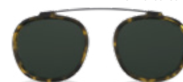
M Solid G Gray Ref. 20100480704