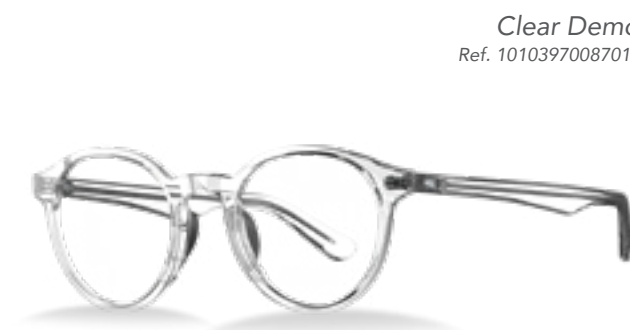
Clear Demo Ref. 10103970087010