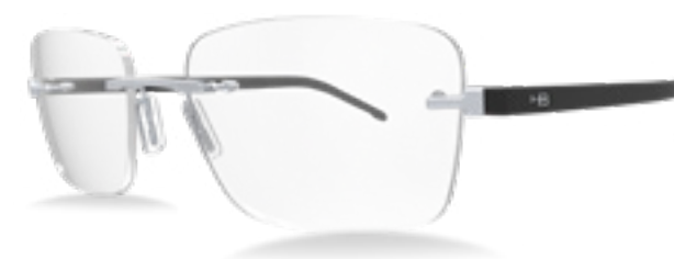
M Grey/M Red Ref. 10104020632010