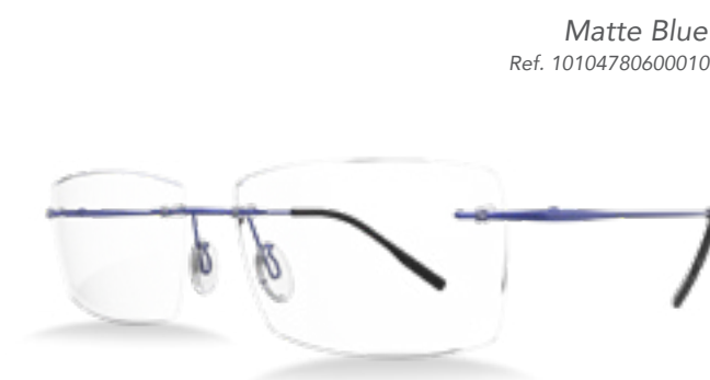
Matte Blue Ref. 10104780600010