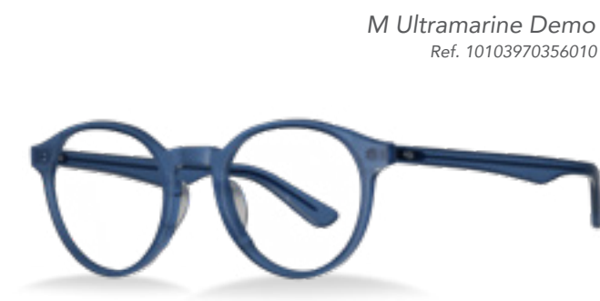
M Ultramarine Demo Ref. 10103970356010