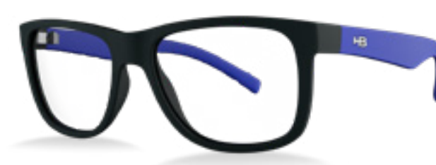
Matte Black Ref. 10100250243010