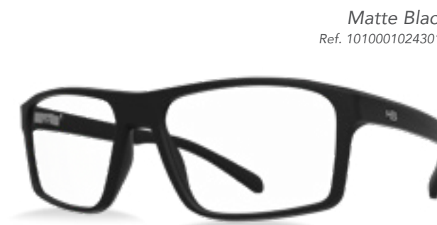
Matte Black Ref. 10100010243010