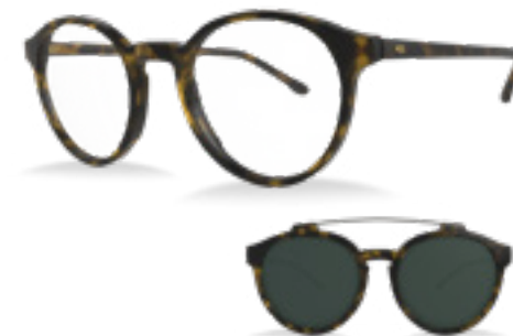
M Ultramarine / Polarized Gray Ref. 10104920356032