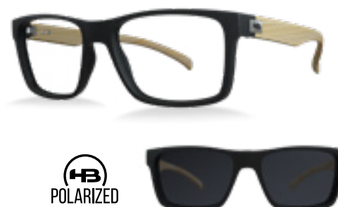
Matte Navy Polarized Gray Ref. 10103390312032