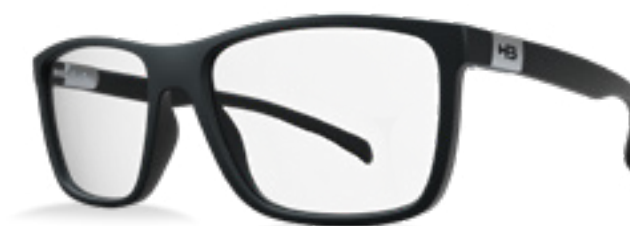
Matte Black D Blue Ref. 10100790003010