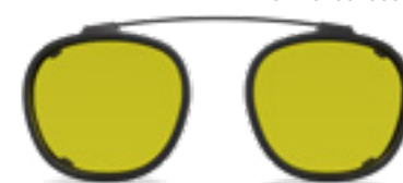
M Black P Blue Ref. 20100480013