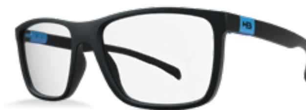
Matte Black D Green Ref. 10100790247010