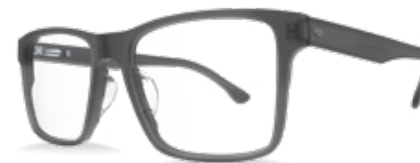
Matte Green Pickle Ref. 10104580700010