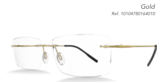
Gold Ref. 10104780164010