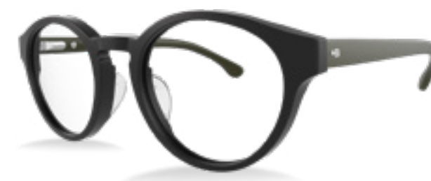
M Night Blue Ref. 10104770699010