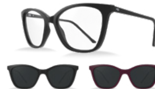
Passionate / Pas + Black Polarized Brown Ref. 10103850689034