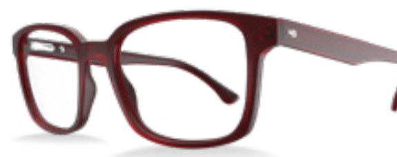
Matte Red Ref. 10104110628010