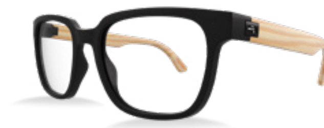
M Green P/Dark W Ref. 10104490716010