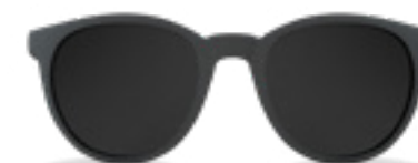
M Grap P Red Ref. 20100080011