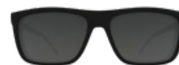
Print Carbon Fi / Polarized Gray Ref. 10103800578032