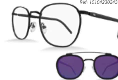
Matte Black / Polarized Gray Ref. 10104230243032