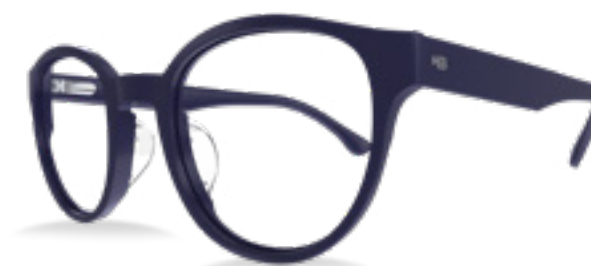
Matte Night Blue Ref. 10104660699010