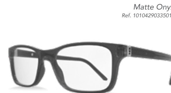
Matte Onyx Ref. 10104290335010