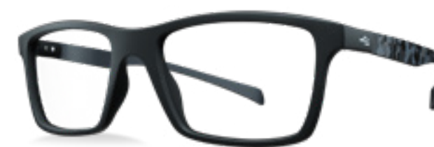
Matte Black D. Blue Ref. 10100750003010