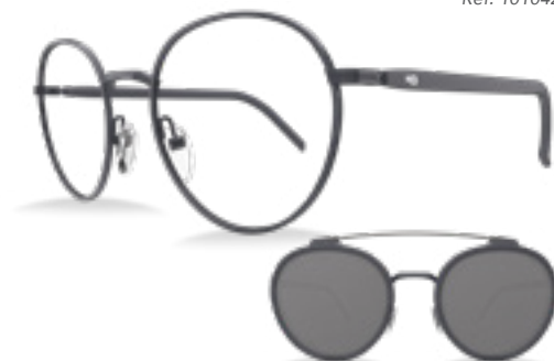
M Graphite Solid / Green Ref. 10104200712032