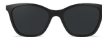
Passio/Po Gray Ref. 20100330061