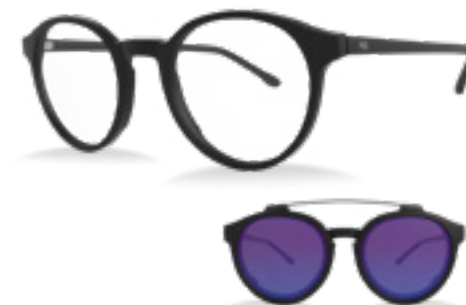
Matte Black / Polarized Gray Ref. 10104920243032