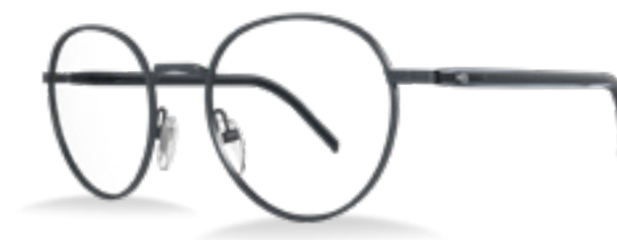
Matte Black Ref. 10103490243010