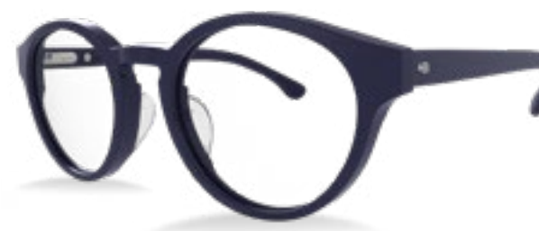
Matte Black Ref. 10104770243010