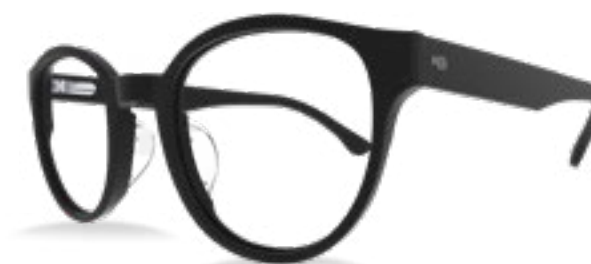
Matte Black Ref. 10104660243010