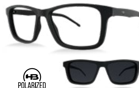
Black Wood / Polarized Gray Ref. 10103510261032