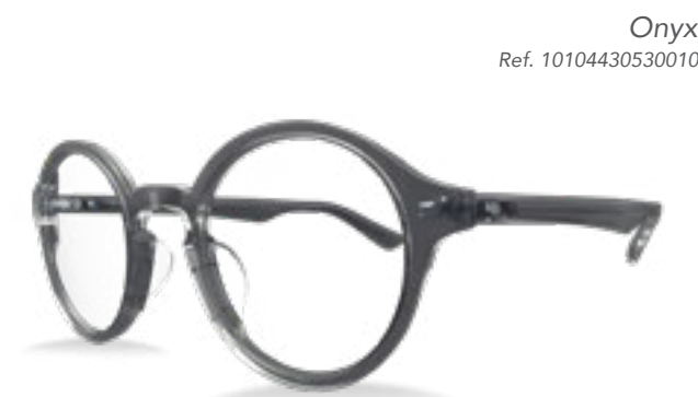
Onyx Ref. 10104430530010