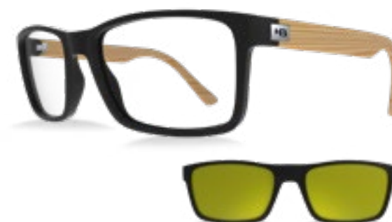
Matte Black / Polarized Gray Ref. 10104200243032