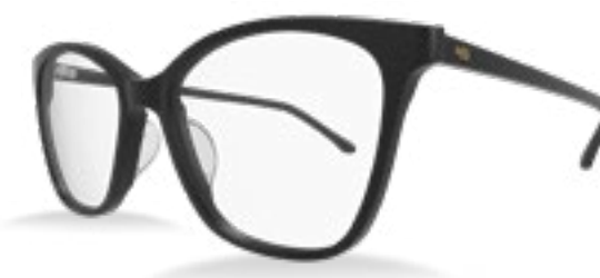
Harmony Blue Ref. 10104890207010