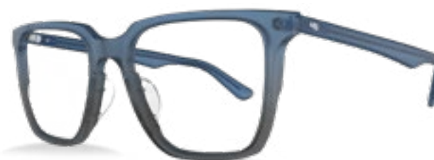
Clear Ref. 10103780087010