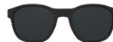
M Navy P Gray Ref. 20100470012