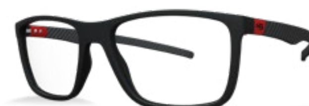
Matte Black Carbon Fiber Ref. 10100870263010