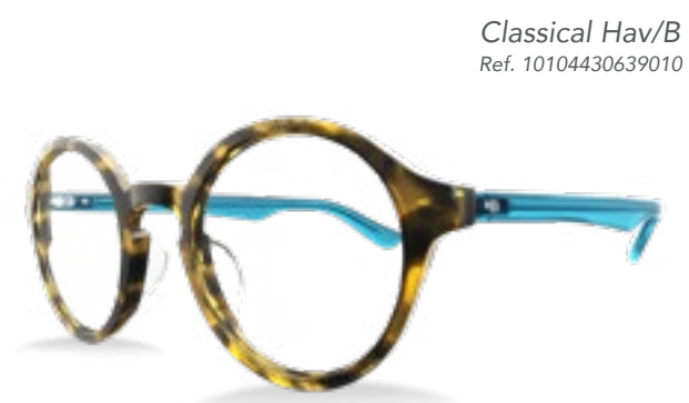
Classical Hav/B Ref. 10104430639010