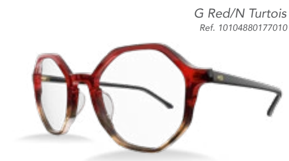
G Red/N Turtois Ref. 10104880177010