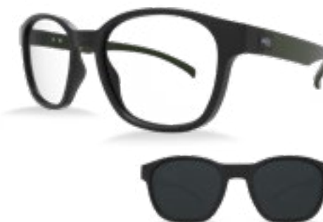
M Navy/Night Bl Gray/Night Drive Ref. 10104480714073