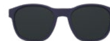
M Black N Drive Ref. 20100470672