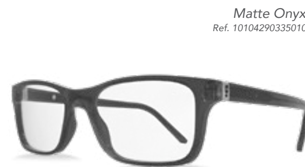
Matte Onyx Ref. 10104290335010