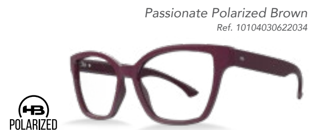
Passionate Polarized Brown Ref. 10104030622034