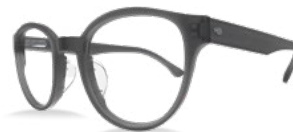
Matte Shadow Gray Ref. 10104660701010