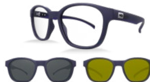
Matte Black Gray Night Drive Ref. 10104480243032