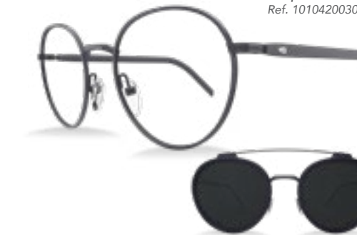
M Black / Polarized Blue Ref. 10104200243033