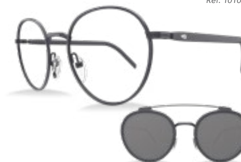
M Graphite Solid / Green Ref. 10104200712032