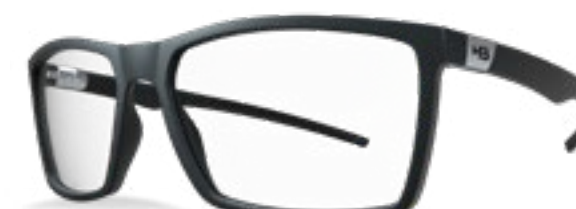
Matte Navy Ref. 10100760312010