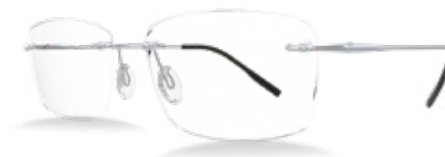
Matte Blue Ref. 10104320600010