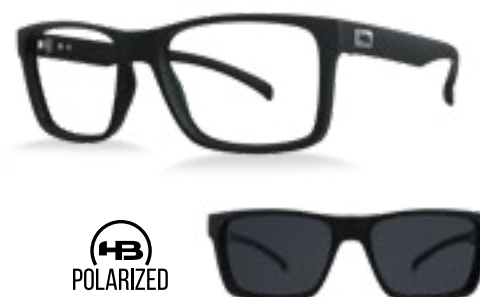
Matte Black Polarized Blue Ref. 10103390243033