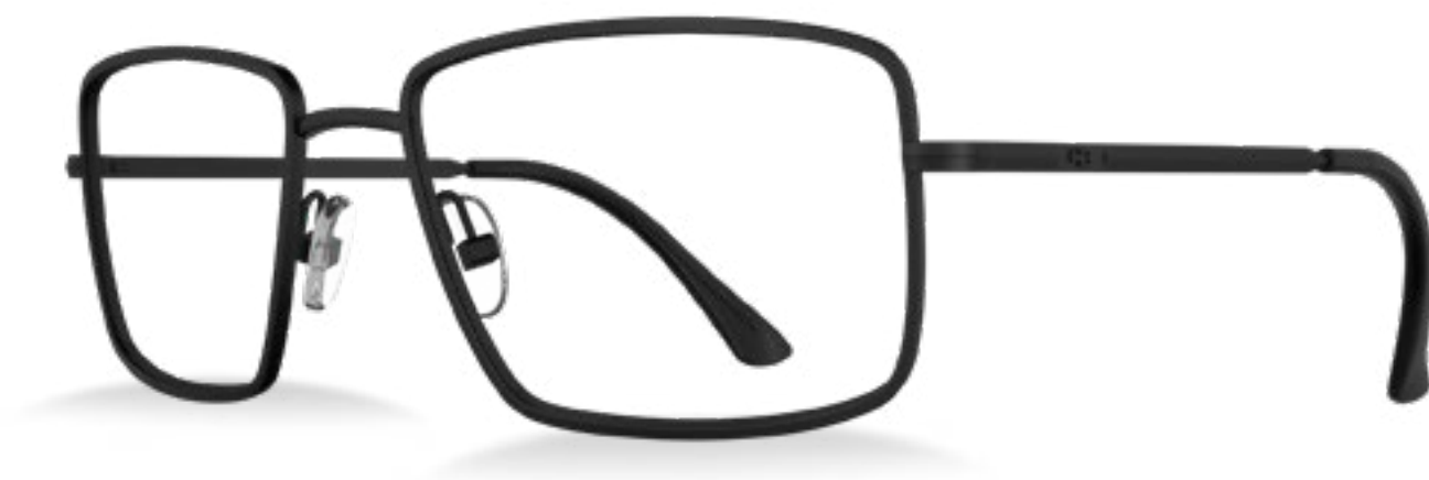
Matte Black Ref. 10103900243010