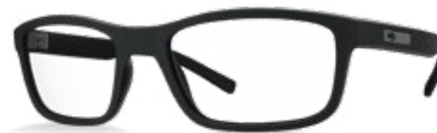
Matte Navy on Marsala Ref. 10101000314010