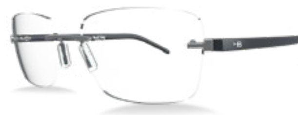
M Grey/M Black Ref. 10104020308010