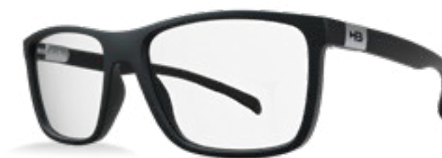
Matte Black D Blue Ref. 10100790003010