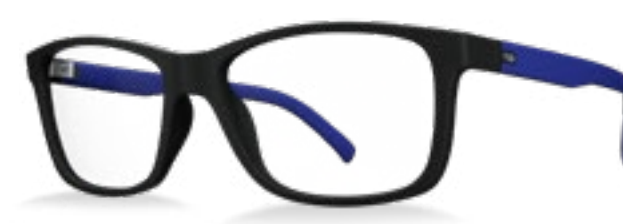
Matte Black D. Red Ref. 10101100251010