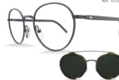
M Graphite / Navy Ref. 10104200304032