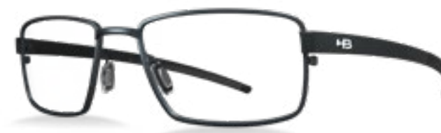
Matte Graphite Yellow Ref. 10100590305010