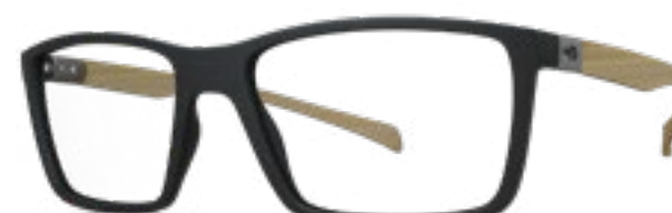
Matte Navy D. Nickel Ref. 10100880517010