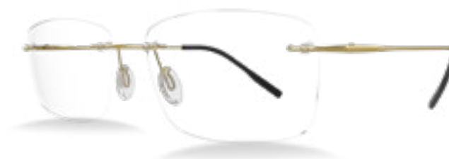
Nickel Ref. 10104320513010