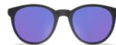
M Black N Drive Ref. 20100080672