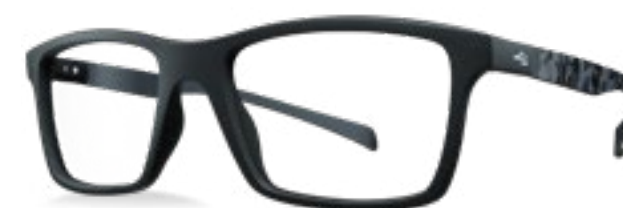
Matte Black D. Blue Ref. 10100750003010