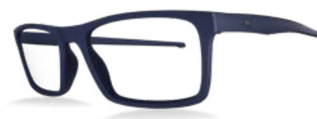
Matte Black Demo Ref. 10102550243010