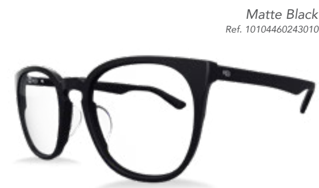
Matte Black Ref. 10104460243010