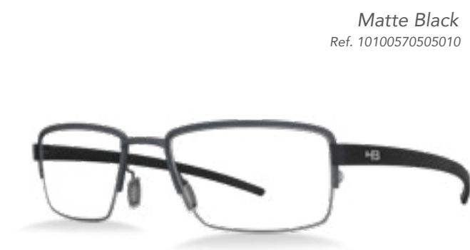
Matte Black Ref. 10100570505010