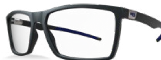
Matte Black Ref. 10100760243010