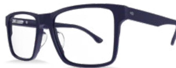
M Shadow Gray Ref. 10104580701010