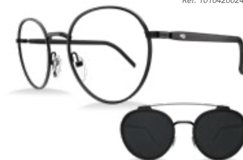
Graphite / Polarized Silver Ref. 10104200696035