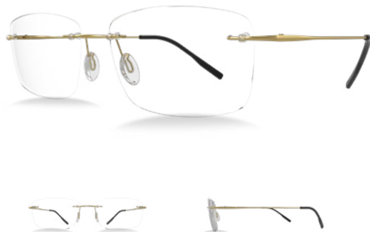
Gold Ref. 10104320164010