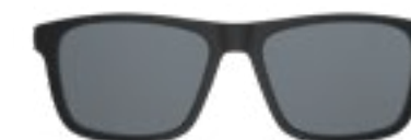
Matte Black Red Ref. 20100240675