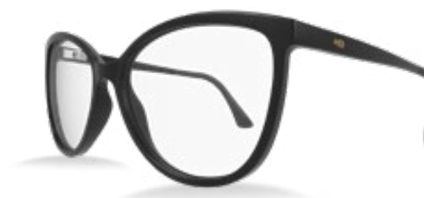
Green Shades Ref. 10104840206010