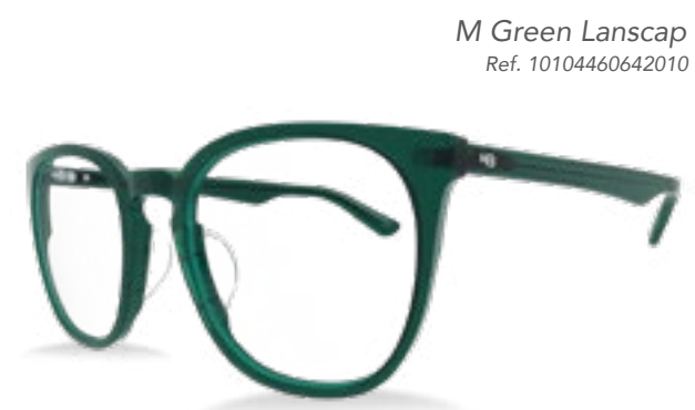
M Green Lanscap Ref. 10104460642010