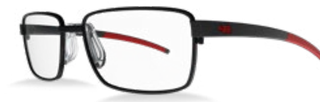
M Black M Navy Ref. 10102850563010