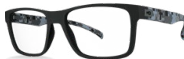
Matte Black D. Graphite Ref. 10101080246010