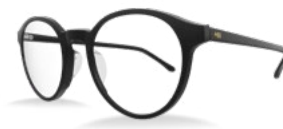
Matte Steel Blue/Pink Ref. 10104870720010