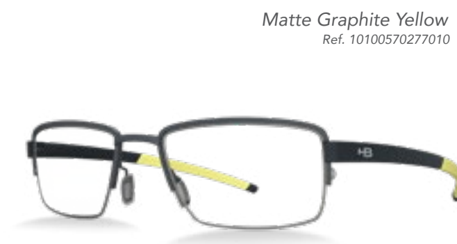
Matte Graphite Yellow Ref. 10100570277010