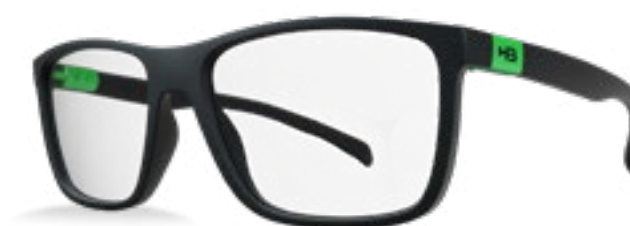
Matte Navy Ref. 10100790312010