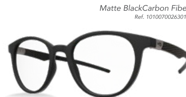
Matte Black Carbon Fiber Ref. 10100700263010