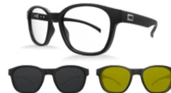
Matte Black / Polarized Gray Ref. 10104480243032