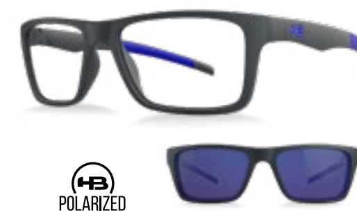
Matte Navy / Polarized Gray Ref. 10101280312032