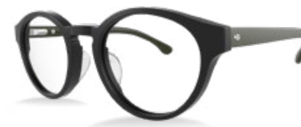
M Night Blue Ref. 10104770699010