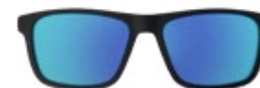
Matte Black P Gray Ref. 20100240009