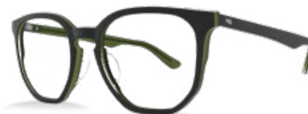
Matte Black Ref. 10103770243010