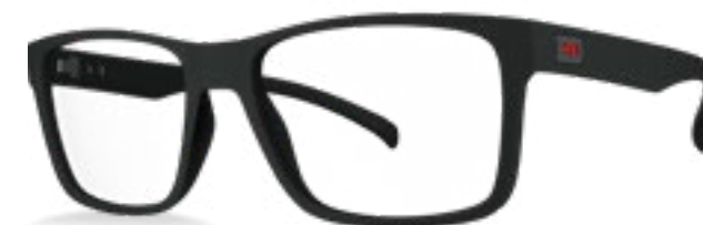
Matte Black / D. White Ref. 10101080252010