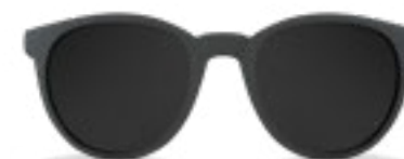
M Grap P Red Ref. 20100080011