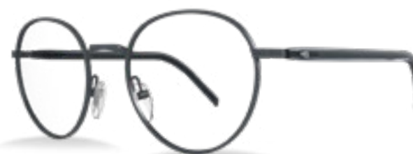
Matte Black Ref. 10103490243010