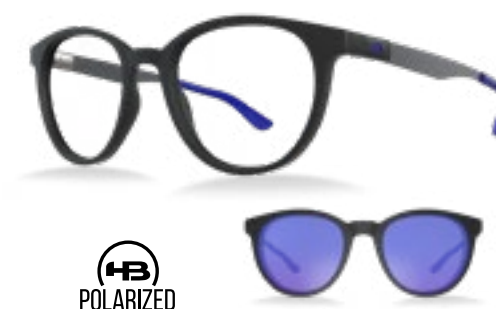
Matte Black Pol Gray Ref. 10102530243032