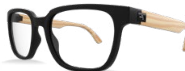
M Green P/Dark W Ref. 10104490716010