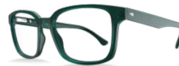
Landscape Green Ref. 10104110630010