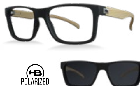
Matte Navy Polarized Gray Ref. 10103390312032