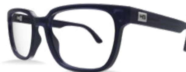
M Shadow Gray Ref. 10104490701010