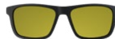
Matte Black P Blue Ref. 20100240013