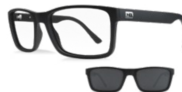
M Black / Gray Night Ref. 10104260243073