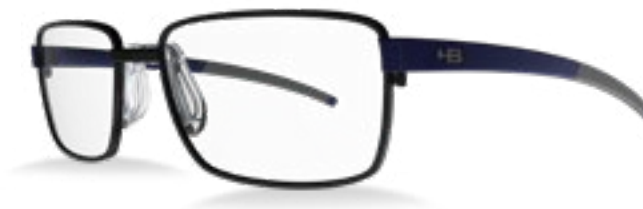
M Graph M Black Ref. 10102850505010