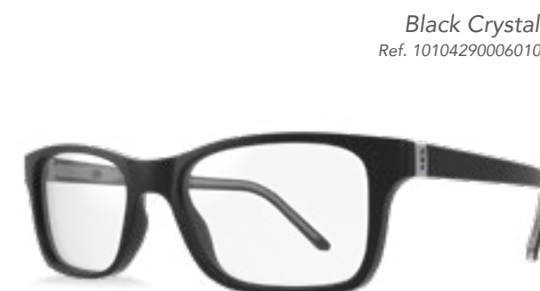
Black Crystal Ref. 10104290006010