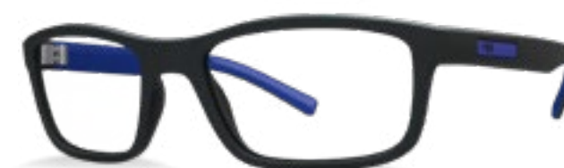
Matte Black on Blue Ref. 10101000254010