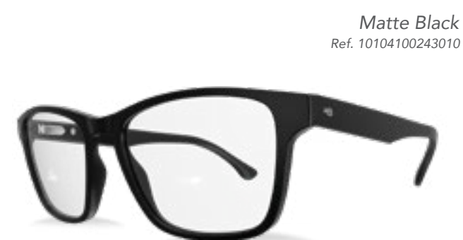
Matte Black Ref. 10104100243010