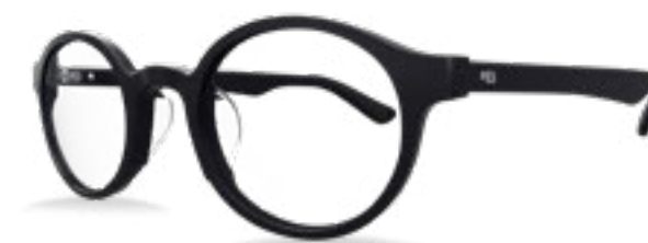
Matte Black Ref. 10104440243010