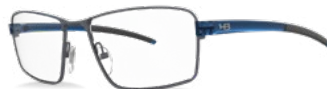
M Black/Onyx Ref. 10104270634010