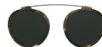
M Navy P Gray Ref. 20100360012