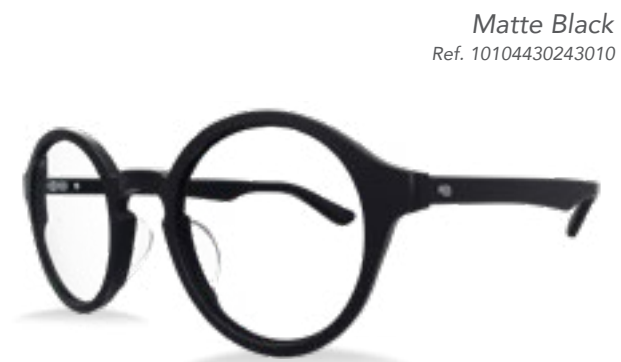
Matte Black Ref. 10104430243010