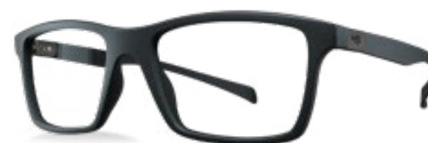
Matte Black Camouflaged Ref. 10100750258010