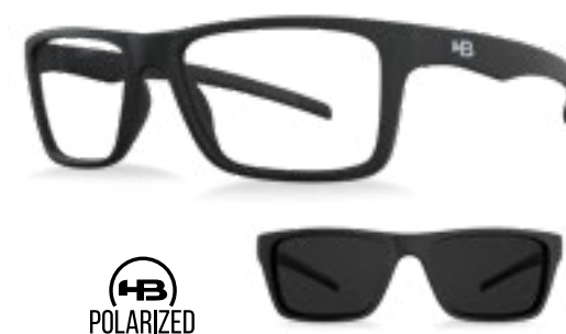
Matte Graphite / Polarized Blue Ref. 10101280302033