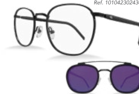
Matte Black / Polarized Gray Ref. 10104230243032