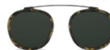
M Solid G Gray Ref. 20100480704