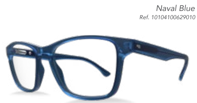
Naval Blue Ref. 10104100629010