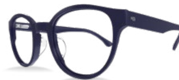
Matte Night Blue Ref. 10104660699010