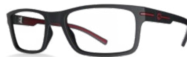
Matte Black Ref. 10100920243010