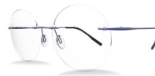
Nickel Ref. 10104790513010