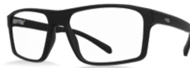
M Fade | Blue M Ref. 10100010553010