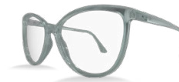
Havana Turtle Ref. 10104840214010