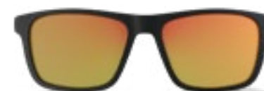
Matte Black P Silver Ref. 20100240015