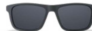
M Navy Silver Ref. 20100240676