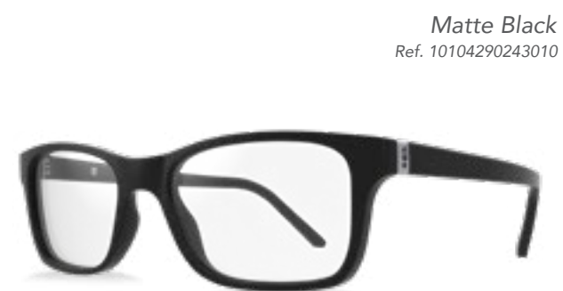
Matte Black Ref. 10104290243010

Dobradiças exclusivas, maior resistência.