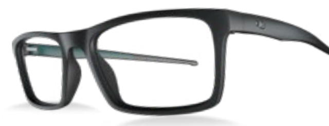
Matte Navy Demo Ref. 10102550312010