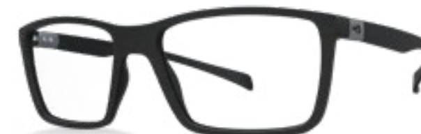
Matte Black D Blue Ref. 10100880003010