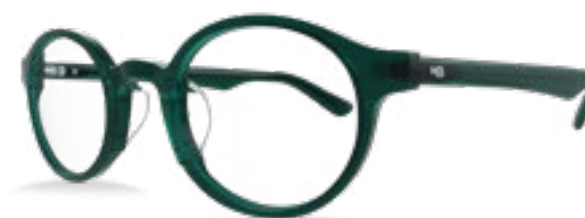
Landscape Green Ref. 10104440630010