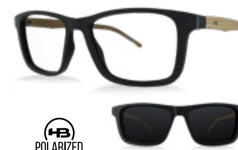
Matte Navy / Polarized Gray Ref. 10103510312032