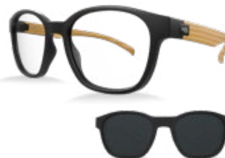
M Black/S Green Polarized Gray Ref. 10104480715032