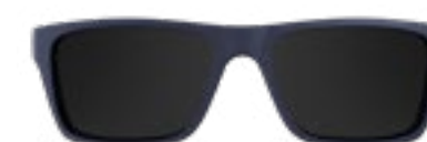
M Black N Drive Ref. 20100040672