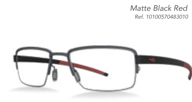
Matte Black Red Ref. 10100570483010