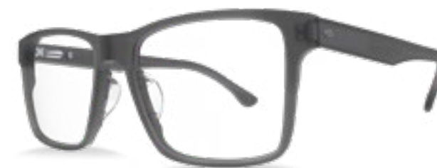
Matte Green Pickle Ref. 10104580700010