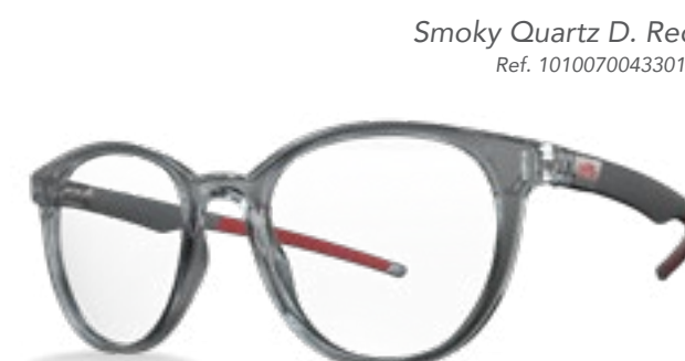
Smoky Quartz D. Red Ref. 10100700433010