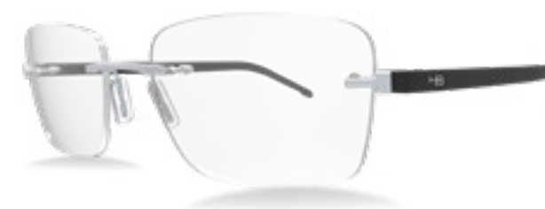
M Grey/M Red Ref. 10104020632010