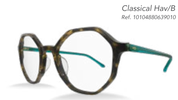
Classical Hav/B Ref. 10104880639010