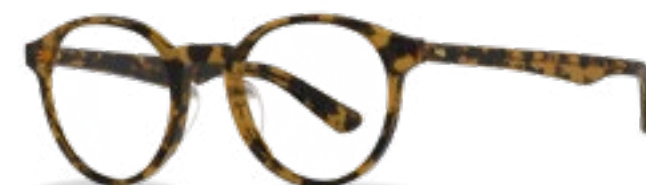
Clear Demo Ref. 10103970087010