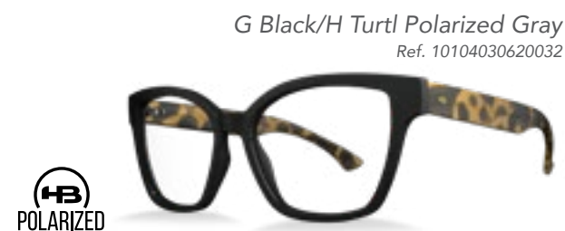
G Black/H Turtl Polarized Gray Ref. 10104030620032

Visão nítida e precisa, com proteção total contra raios ultravioleta e atenuação da luz azul danosa.