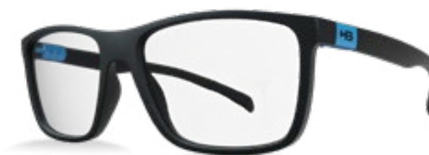
Matte Black D Green Ref. 10100790247010