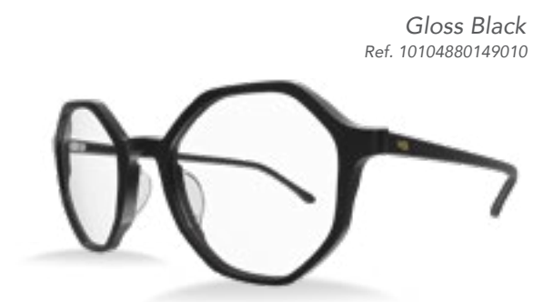
Gloss Black Ref. 10104880149010