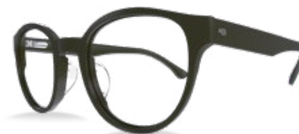
Matte Green Pickle Ref. 10104660700010