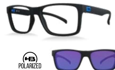
M Black/Wood Polarized Gray Ref. 10103390261032