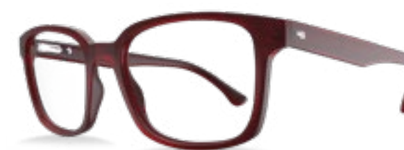
Matte Red Ref. 10104110628010