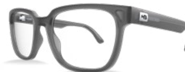
Matte Black Ref. 10104490243010