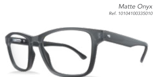
Matte Onyx Ref. 10104100335010