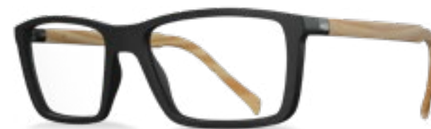
M Black/Wood / Polarized Gray Ref. 10103790261032

Visão nítida e precisa, com proteção total contra raios ultravioleta e atenuação da luz azul danosa.