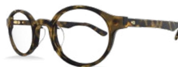
Classical Havan Ref. 10104440564010