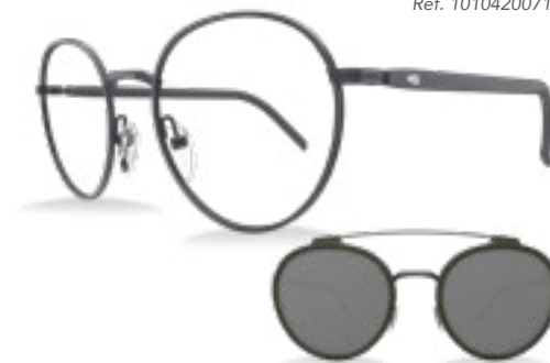
M Graphite Turt G15 / Green Ref. 10104200697006