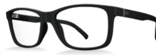
Matte Black Blue Ref. 10101100031010