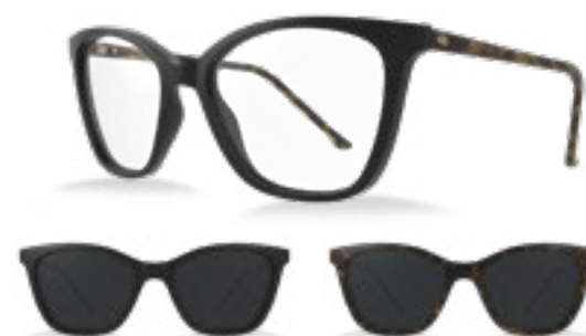
Gloss Black / Black+Havana Polarized Gray Ref. 10103850688032