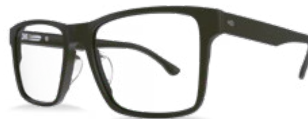
Matte Black Ref. 10104580243010