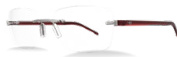
M Grey/Naval B Ref. 10104020633010