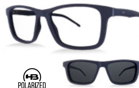
N Carbon Fiber / Polarized Gray Ref. 10103510578032