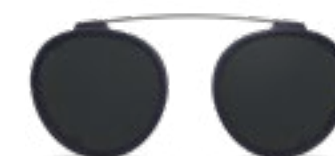
M Solid Green P Gray Ref. 20100360704