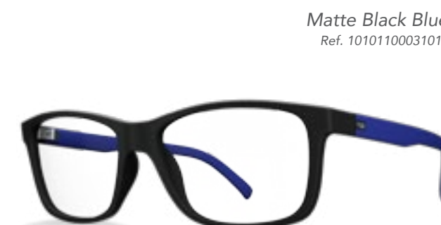
Matte Black Blue Ref. 10101100031010