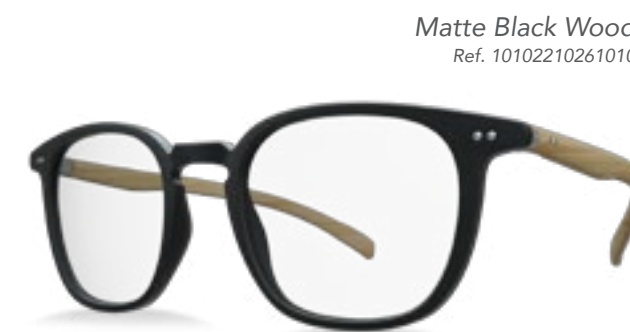
Matte Black Wood Ref. 10102210261010