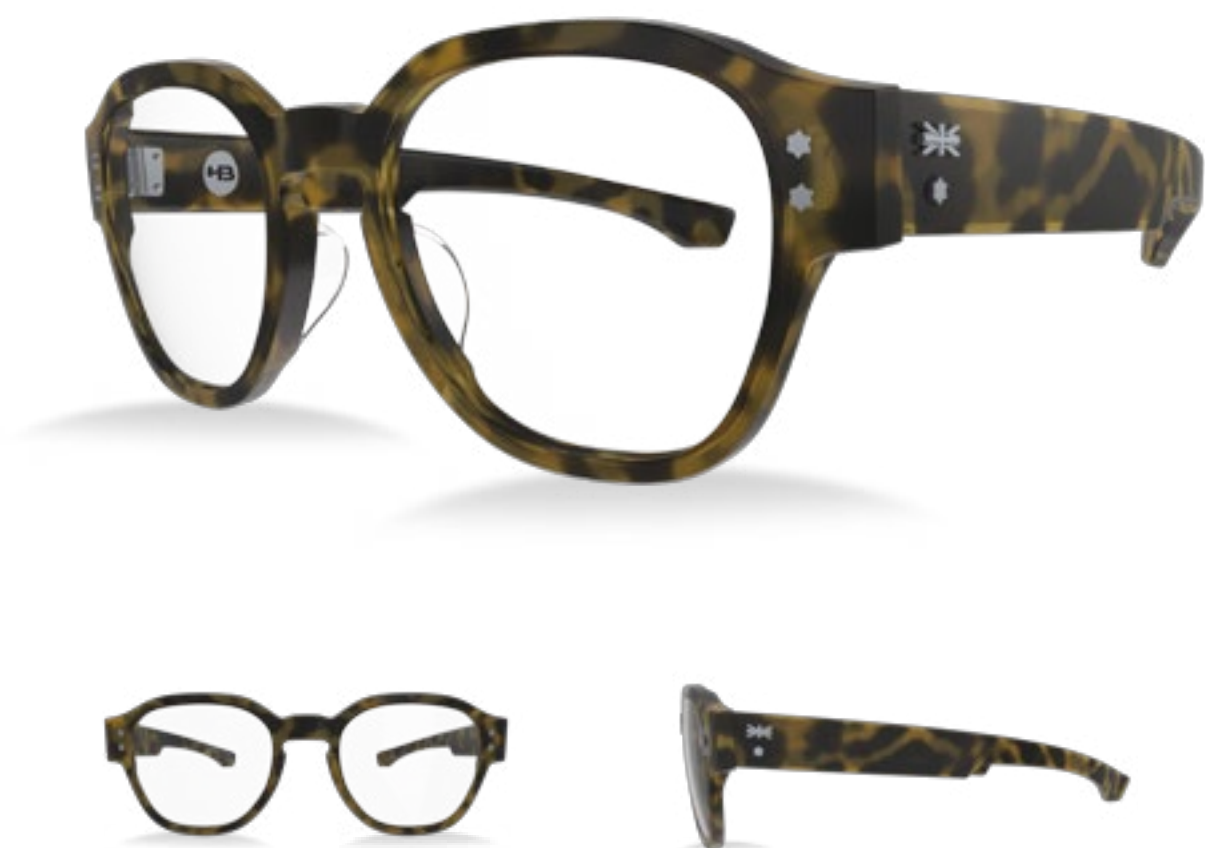
Havana Turtle Ref. 10104150214010