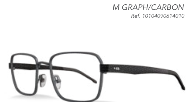
M GRAPH/CARBON Ref. 10104090614010