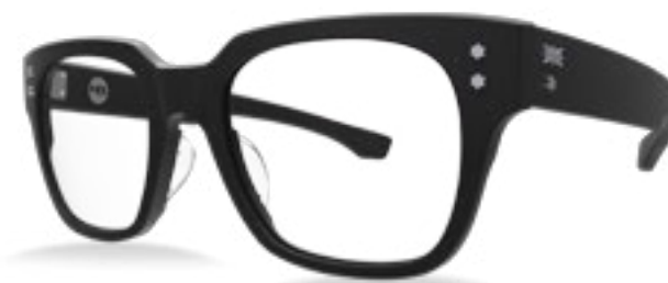
Matte Black Ref. 10104070243010

Hastes com decorativos e rebites exclusivos.