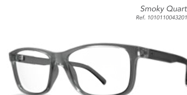
Smoky Quartz Ref. 10101100432010