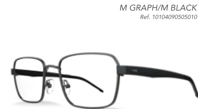
M GRAPH/M BLACK Ref. 10104090505010