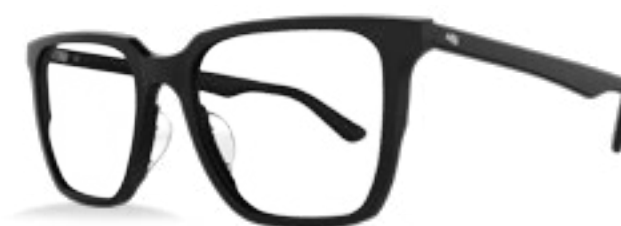
Matte Black Ref. 10103780243010