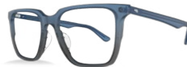
Gra Blue/Onyx Ref. 10103780599010