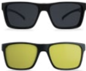
Matte Black / Lenses Gray / Blue Chrome Ref. 10103390243074