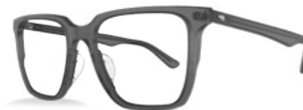
M Smoky Quartz Ref. 10103780352010