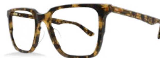
Classical Havan Ref. 10103780564010