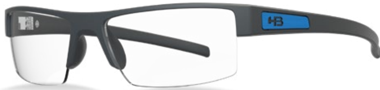
Matte Black Demo Ref. 10103980243010