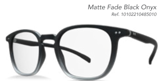
Matte Fade Black Onyx Ref. 10102210485010