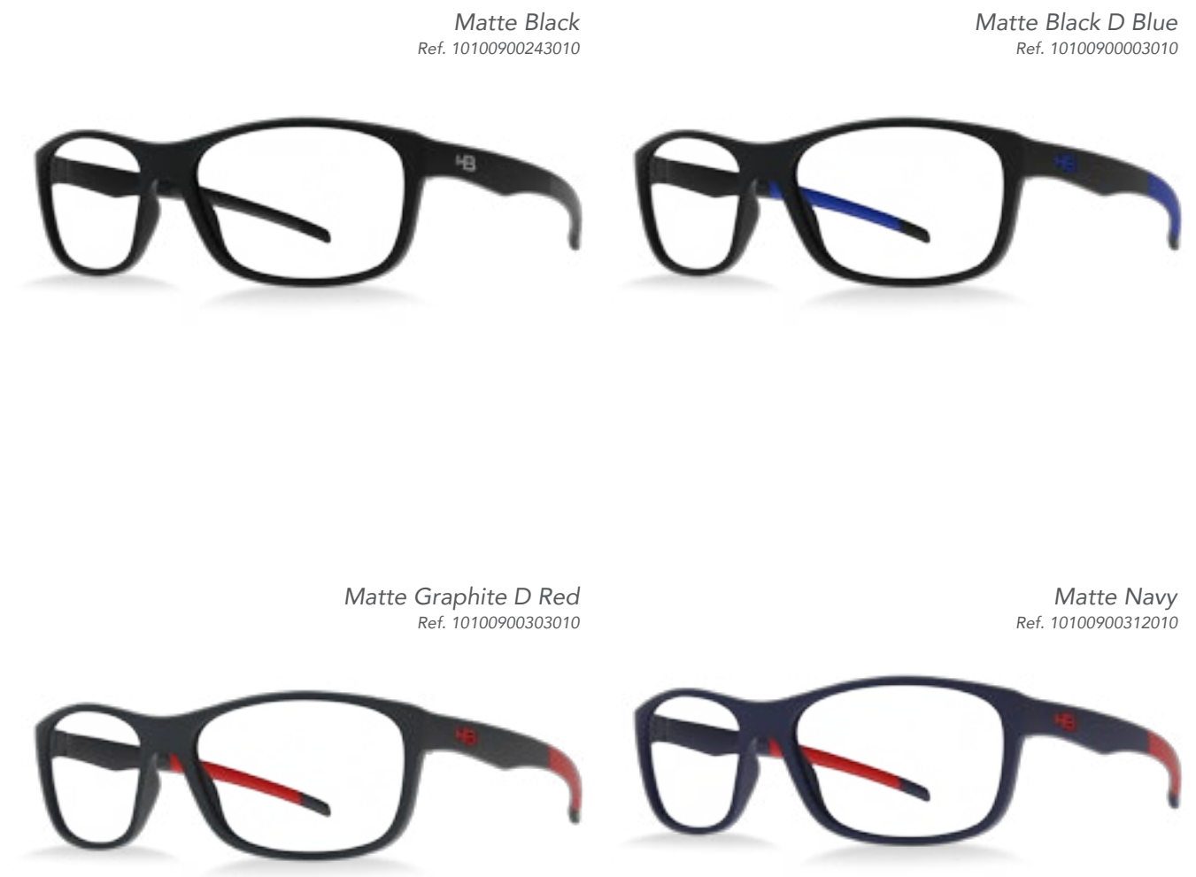
Matte Black Ref. 10100900243010