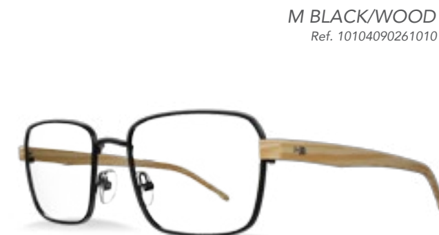
M BLACK/WOOD Ref. 10104090261010