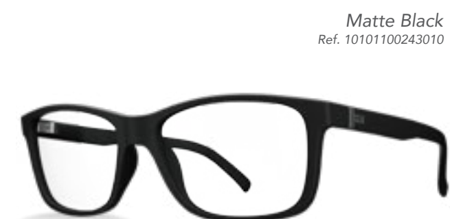
Matte Black Ref. 10101100243010