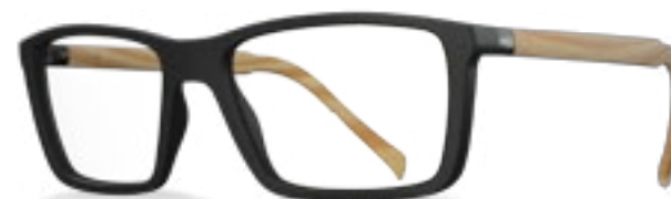
M Black/Wood / Polarized Gray Ref. 10103790261032

Visão nítida e precisa, com proteção total contra raios ultravioleta e atenuação da luz azul danosa.