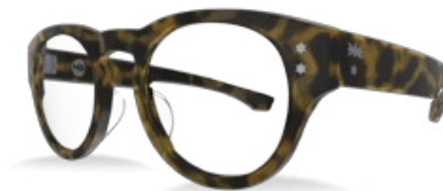
Havana Turtle Ref. 10104140214010

Hastes com decorativos e rebites exclusivos.