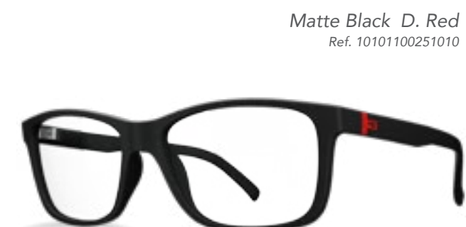
Matte Black D. Red Ref. 10101100251010