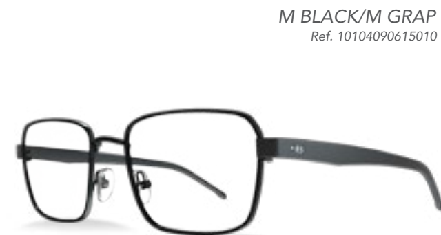
M BLACK/M GRAP Ref. 10104090615010