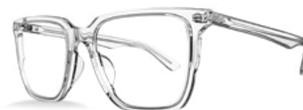
Clear Ref. 10103780087010