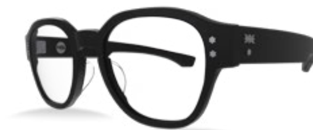
Matte Black Ref. 10104150243010

Hastes com decorativos e rebites exclusivos.