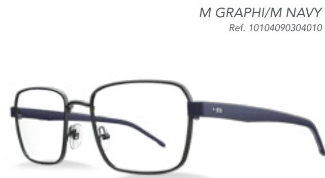
M GRAPHI/M NAVY Ref. 10104090304010