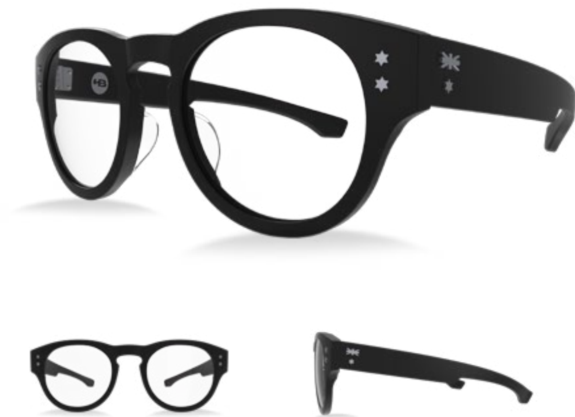
Matte Black Ref. 10104140243010